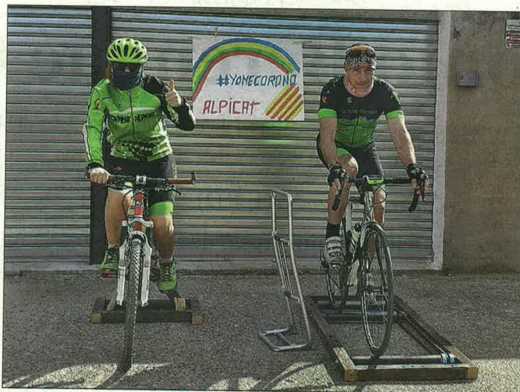
La Challenge Covid-19 Tramdur Alpícat 'rescató' las bicicletas por un día

La primera edición de la #ConFinaRun se convirtió en un éxito con una participación, a las 21.00 horas de ayer, de 2.280 corredores y una recaudación de 18.052 euros que los organizadores darán íntegramente al Institut de Recerca Biomèdica de Lleida para que continúe con su investigación en torno al coronavirus. La cifra puede crecer, dado que las inscripciones permanecerán abiertas toda la semana en www.iter5.cat . Deportistas de elite, corredores anónimos y una cincuenta de organizadores de ca-