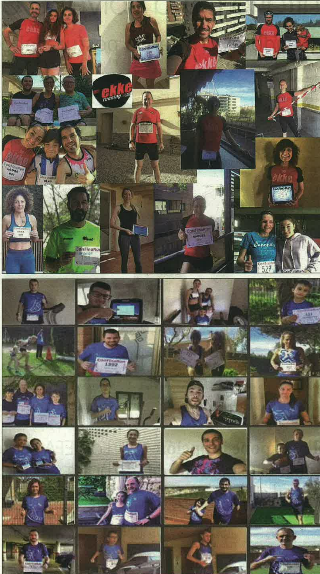
Centenares de leridanos y leridanas demostraron su solidaridad durante otro domingo atípico

Esta cifra fue posible gracias a las aportaciones de los 277 inscritos que participaron sin salir de casa, ya que éste era el espíritu de la cita. La propuesta consistía en practicar ciclismo usando el rodillo, la bicicleta estática, la elíptica, etcétera ya fuera en el pasillo, en el jardín, en la terraza o donde se pudiese. Cada participante escogía la distancia que quería (10, 30, 60 o 100 kilómetros) y la inscripción se hacía conjuntamente con un donativo de 5, 10 o 20 euros.