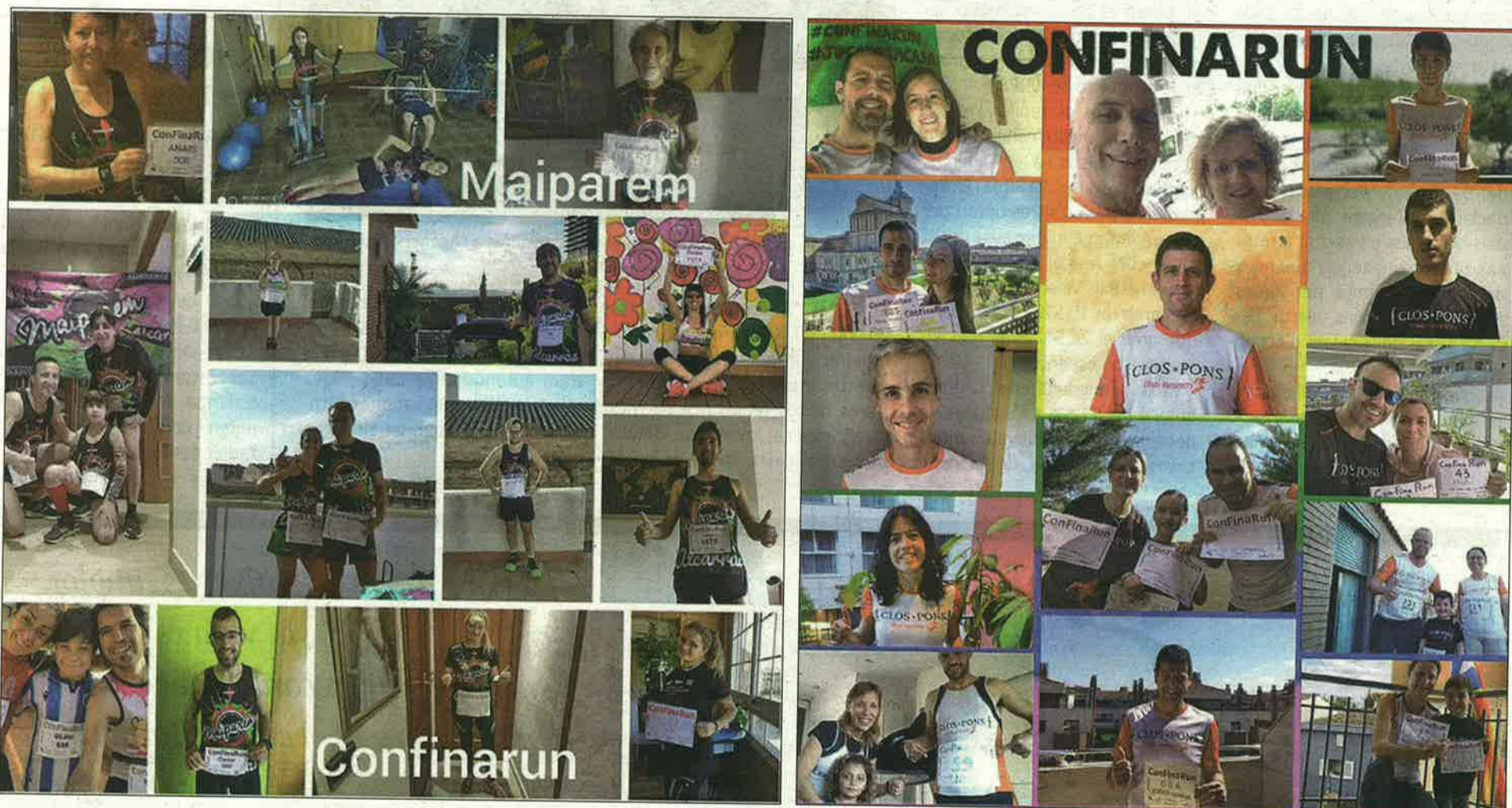
La ConFinaRun superó todas las expectativas con una participación multitudinaria

La ConFinaRun reúne a 2.360 participantes y 18.624 euros y la Challenge Tramdur Alpícat junta a 277 ciclistas y 2.645 euros