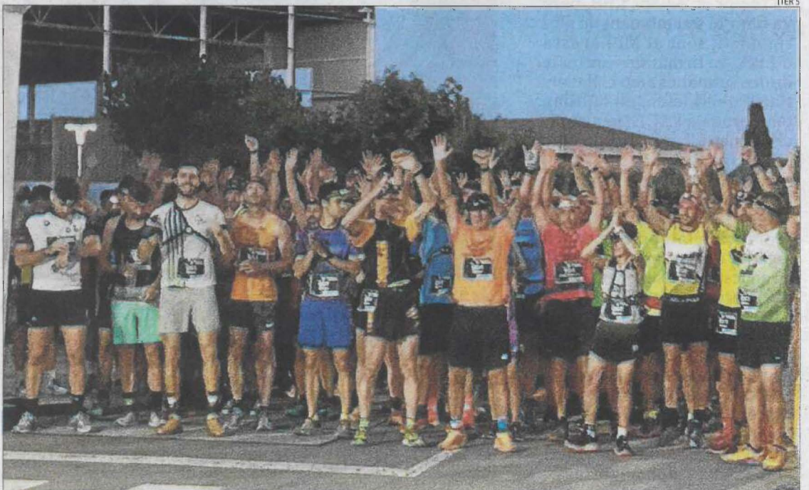
Alpocat va celebrar dissabte una cursa nocturna.