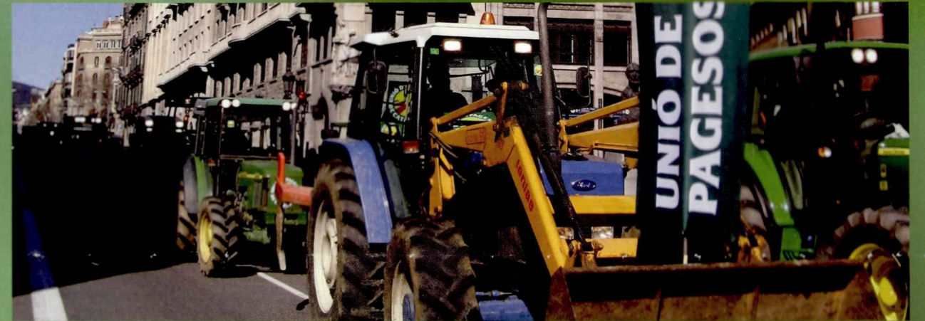
Manifestació 'Per uns preus justos al camp', Barcelona 20/02/2010