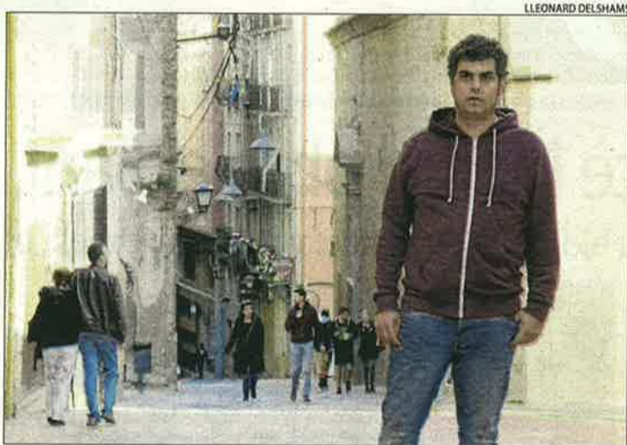
El carrer Cavallers, epicentre literari de Ramon Usall.