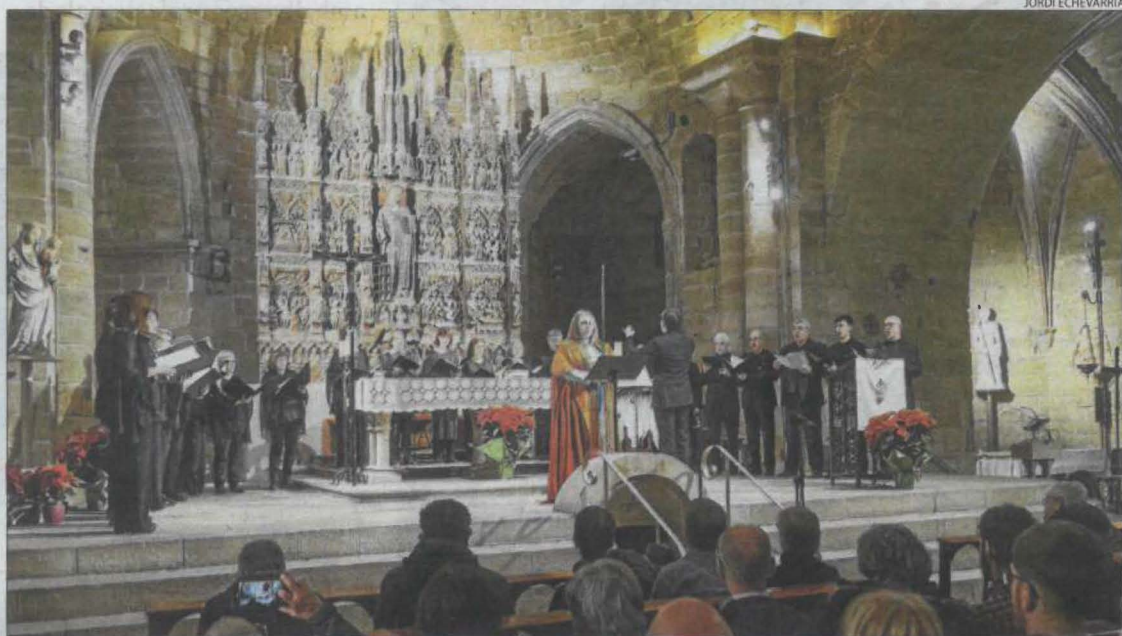
L'església de Sant Llorenç de Lleida va acollir per segon any consecutiu 'El Cant de la Sibil·la'.

També com cada any, la plaça de les Homilies va acollir tot seguit un altre ritu local ancestral, la crema del carro.