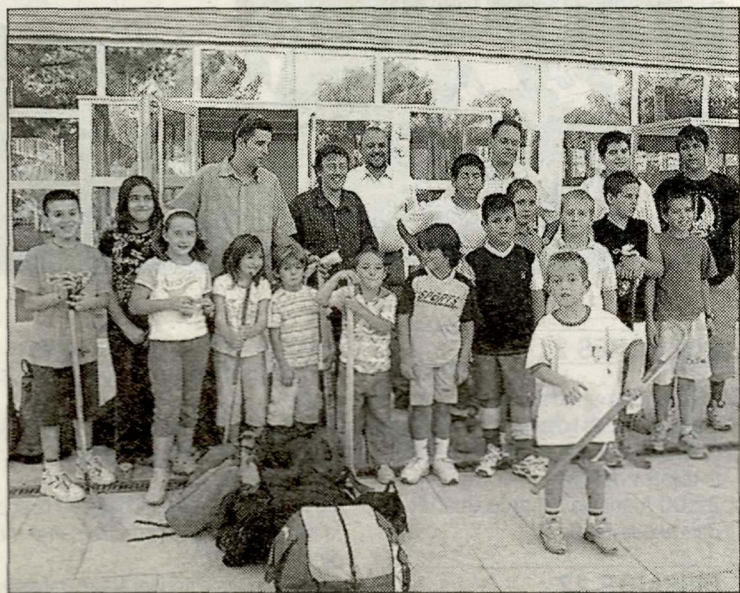
Els menuts disfrutaran de diverses propostes.

Alpicat es calça les botes i els patins per rebre Sant Sebastià. I és que l'esport és l'autèntic protagonista de les festes patronals, en una autèntica marató que es perllongarà fins diumenge. Com a plat fort, la presentació en societat del club de bàsquet Alpicat, programada per a diumenge a dos quarts de cinc.