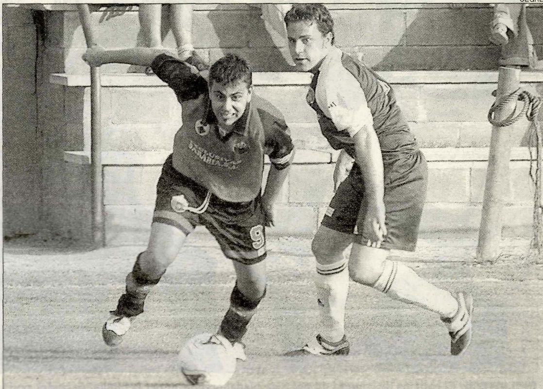
El futbol és un dels protagonistes.

El club de bàsquet d'Alpicat es presentarà en societat diumenge, abans de l'última sessió de ball