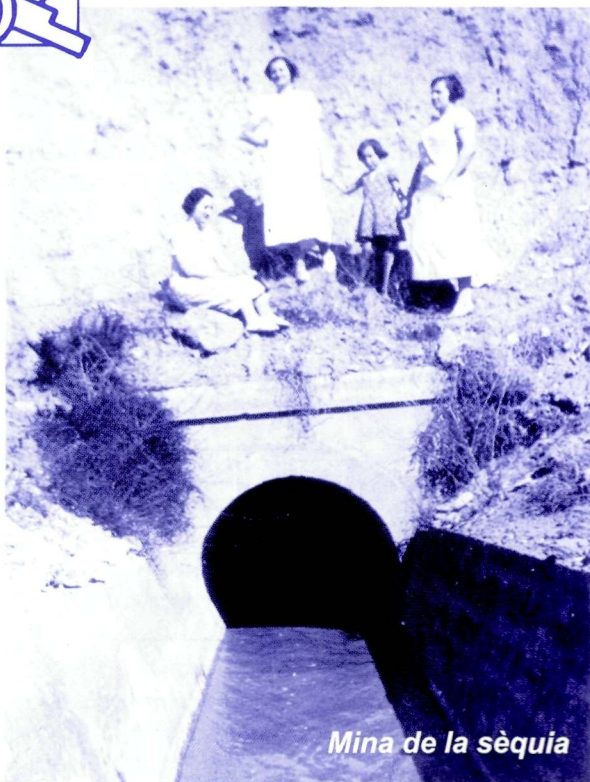
Mina de la sèquia

En el darrer número de la revista transcrivíem la primera part de la conferència pronunciada amb motiu de la commemoració del centenari del Canal d'Aragó i Catalunya que va celebrar la comunitat de regants d'Alpicat el propassat 20 d'abril. Ara presentem la segona part, que es centra en els inicis del sindicat de regs.