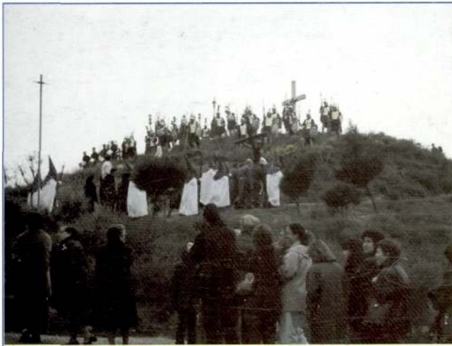
Processó al Calvari. Divendres Sant. 29 de març de 2002