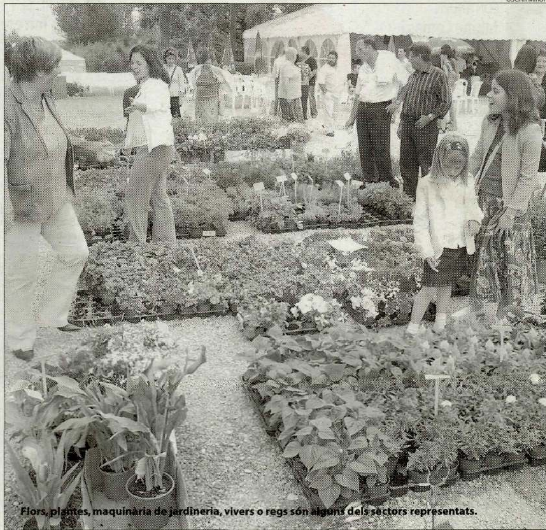
Flors, plantes, maquinària de jardineria, viviers o regs són alguns dels sectors representats.

L'exhibició de castellers, les jornades tècniques sobre heliicultura o la decoració i les escultures amb fruita, fetes per Romi Pijuan, brillaran amb