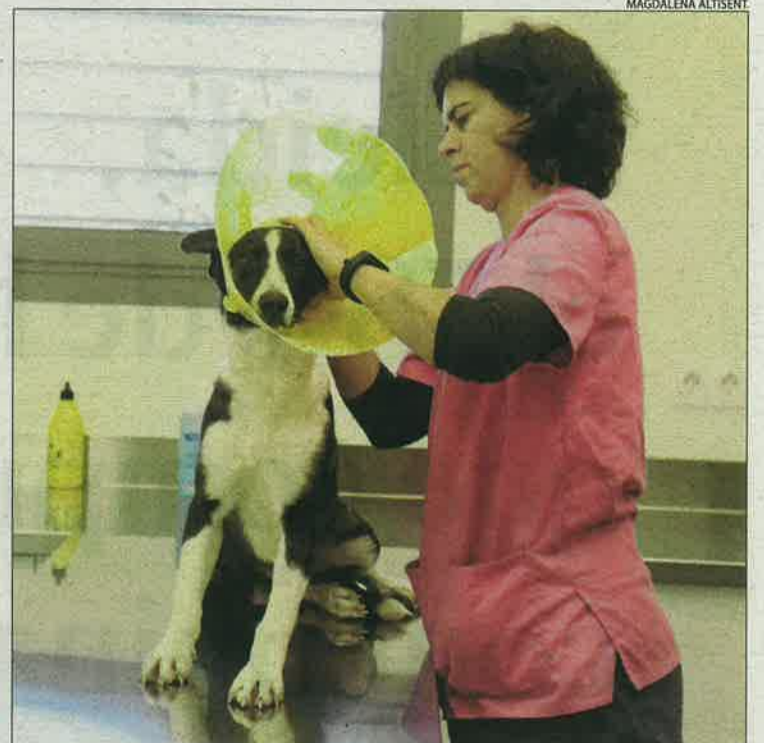
La coordinadora del centre, amb un animal ja intervenint.