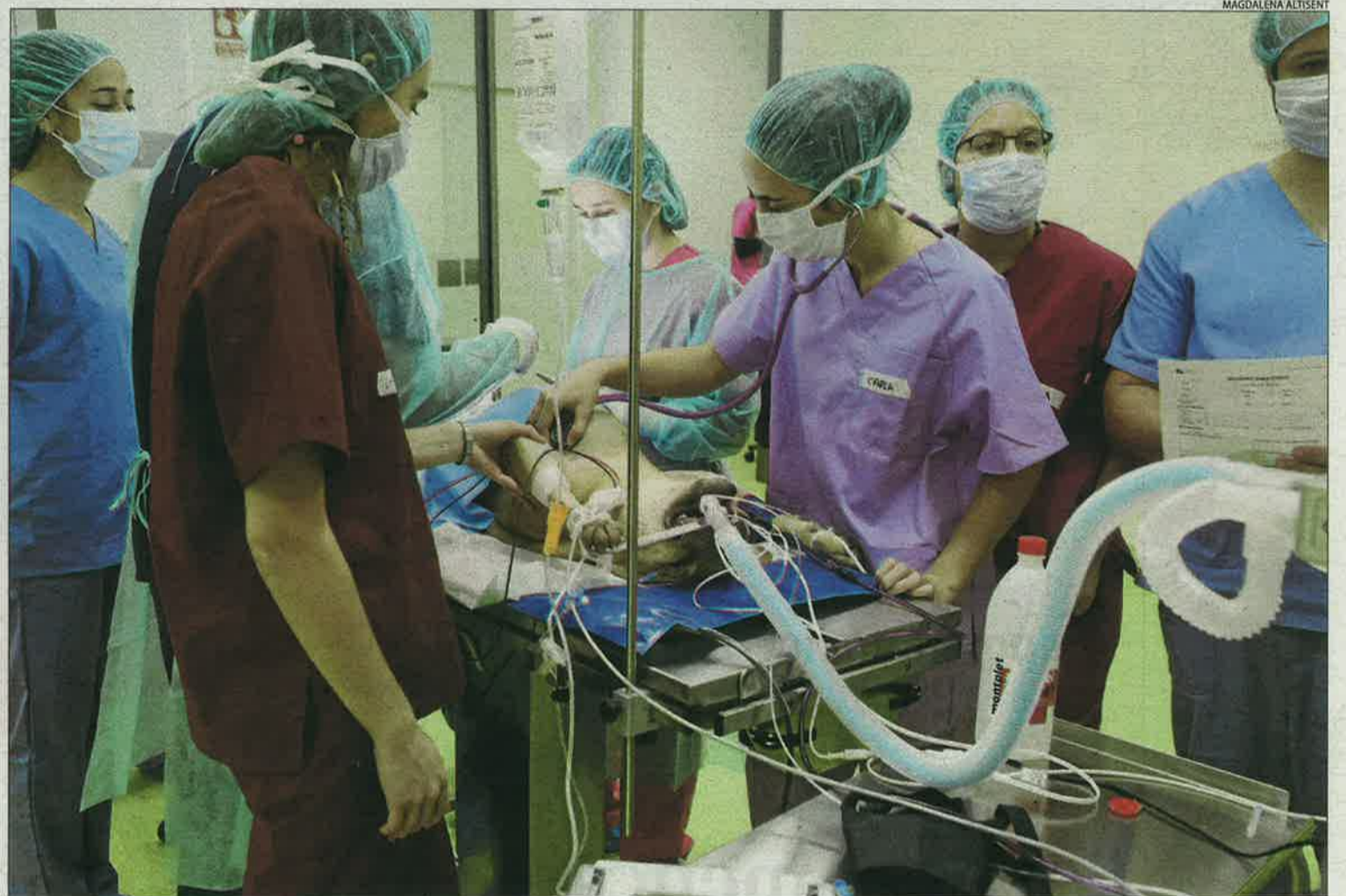
Alumnes del doble grau de Veterinària i Ciència i Salut Animal, al quiròfan ajudant en l'operació d'una gossa.

La unitat compta amb consultes que simulen les d'una clínica, on els alumnes aprenen a fer una exploració física