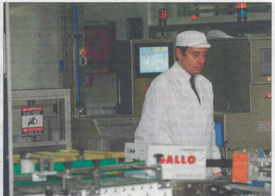
Pastas Gallo de Granollers va traslladar la seu a Còrdova i ara hi portarà la producció ■ EPA

Alerta que, si no, es podrien perdre els lligams amb els centres de decisió i treball que es mantenen a Catalunya