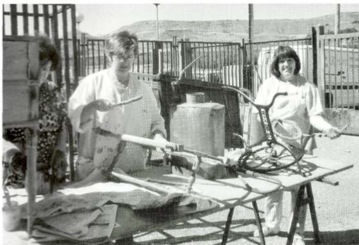
Curs de restauració