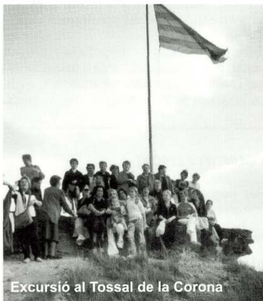
Excursió al Tossal de la Corona

La setmana cultural de Nadal també va ser molt participativa. Tant a les diferents xerrades com a les excursions i tots els actes. També vàrem participar a la marató de TV3, i vam recaudar aquell mateix dia 600 €. Es va