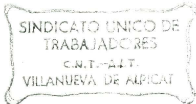
Segell de la CNT