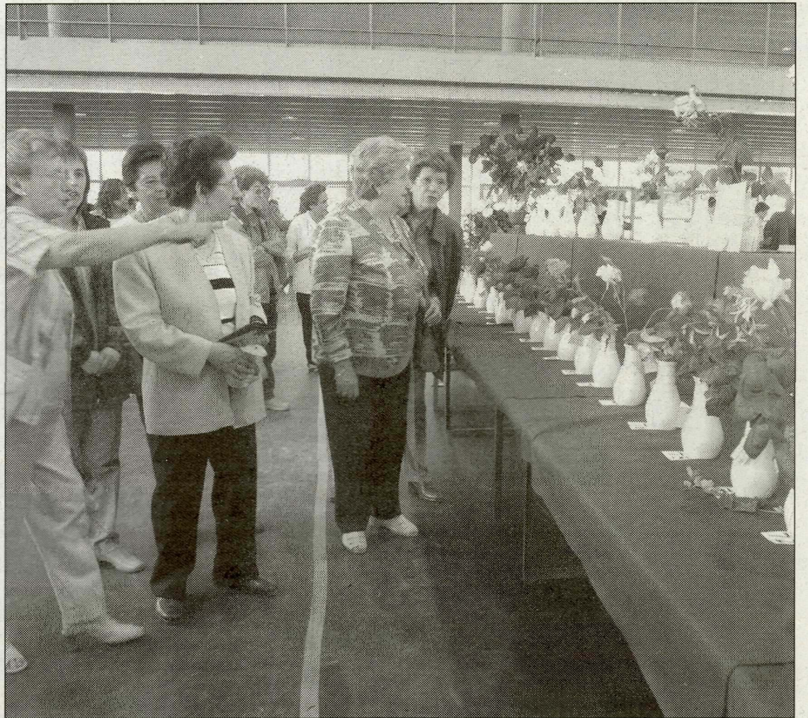
Els exemplars estaran exposats al pavelló.

Centres florals o pintura ràpida, objecte d'altres convocatòries que se celebren dissabte i diumenge