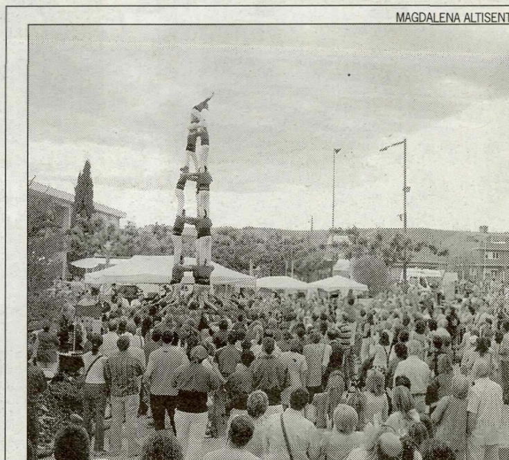
L'exhibició comptarà amb la colla de Lleida i la de Sant Feliu.