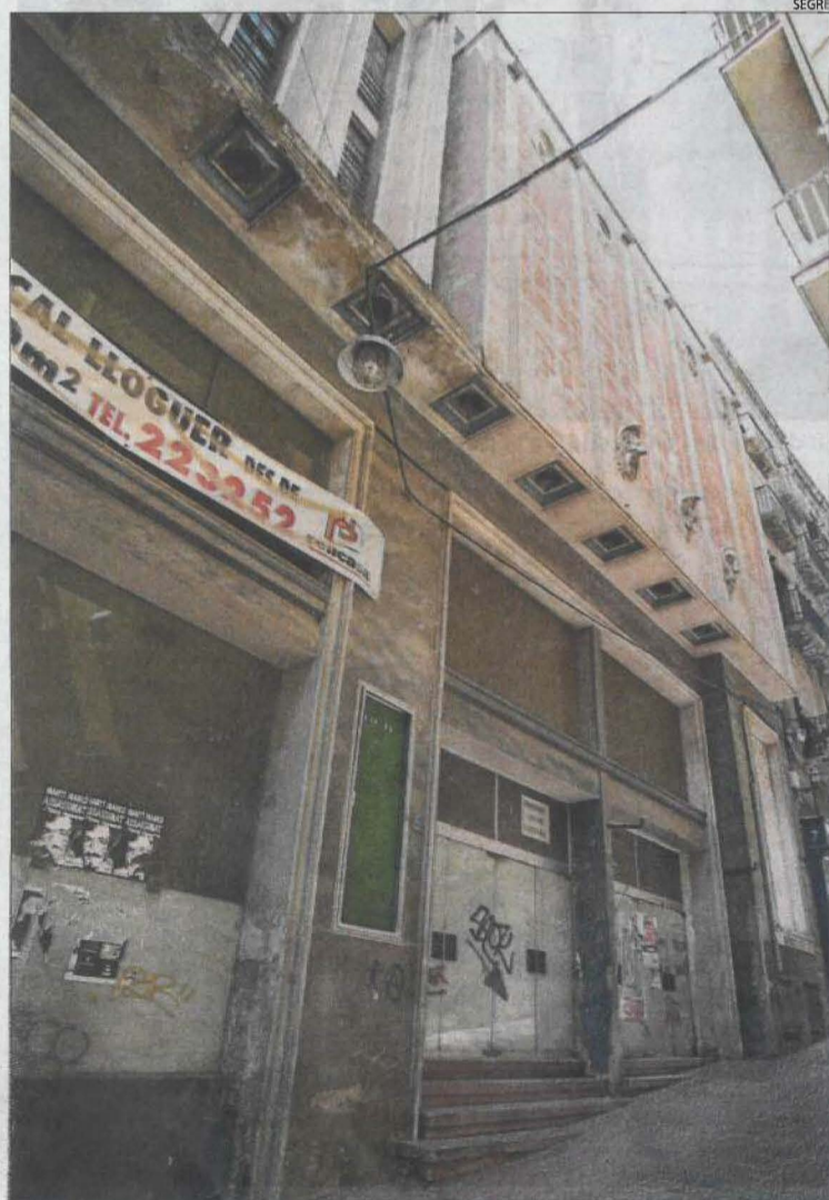
L'històric cinema Granados de Lleida va tancar les portes el 1990.

La primera sala de cine fou la de Cal Tersa, inaugurada el 20 de setembre de 1924, amb la pel·lícula 'Armas al hombro', de Charles Chaplin