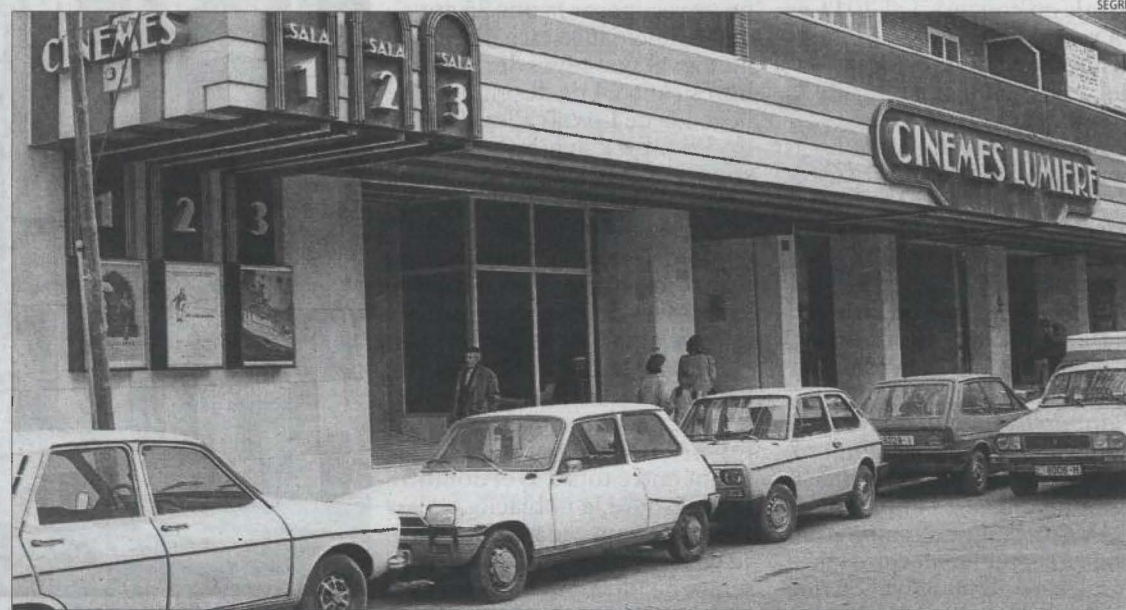
El multisales Lumière, signe de modernitat a la Lleida dels anys 80, va acabar tancant l'any 2007.