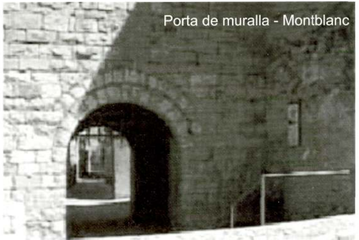
Porta de muralla - Montblanc

En temps de reconquesta, 1155, Ramon Berenguer IV va lliurar la primera carta de població del que arribaria a ser una vila forta a mig camí de Tarragona a Lleida, com bé coneixem tots aquells que ens paràvem a fer un cafè algun diumenge cap a Salou.