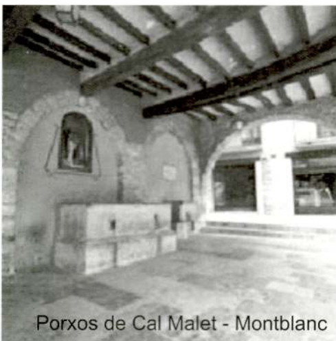
Porxos de Cal Malet - Montblanc

Serviren per mesurar el gra entre 1752 i 1905.