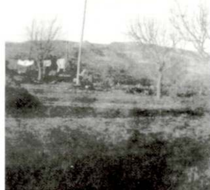
Tossal de la Corona i serra dels Soldats