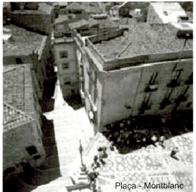
Plaça - Montblanc

El 26 de setembre de 1947 Montblanc fou declarat Conjunt Monumental i Artístic i, per