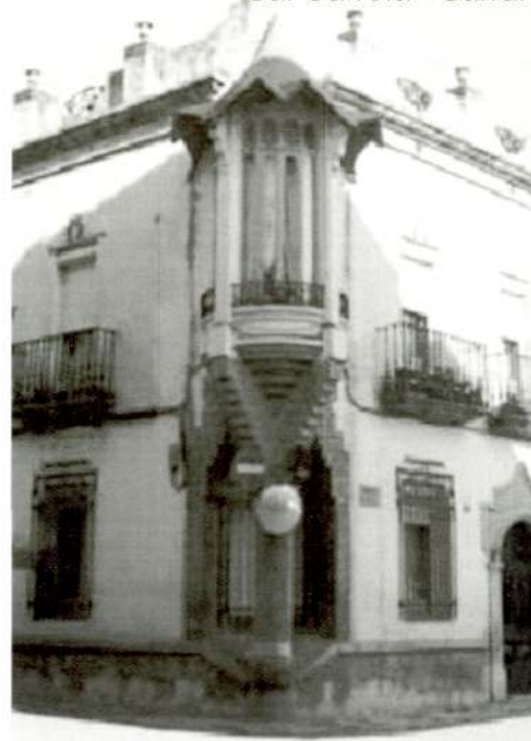
Cal Garrofa - Sarral

Destaca per tenir 15 tallers de la indústria artesanal de l'alabastre que exporten arreu del món, per una arrelada tradició vinatera que s'endinsa en temps dels romans i cases modernistes com la de Cal Garrofa, sarralenc que va fer fortuna a l'Amèrica Central. En el Museu de l'Alabastre es pot veure treballar els