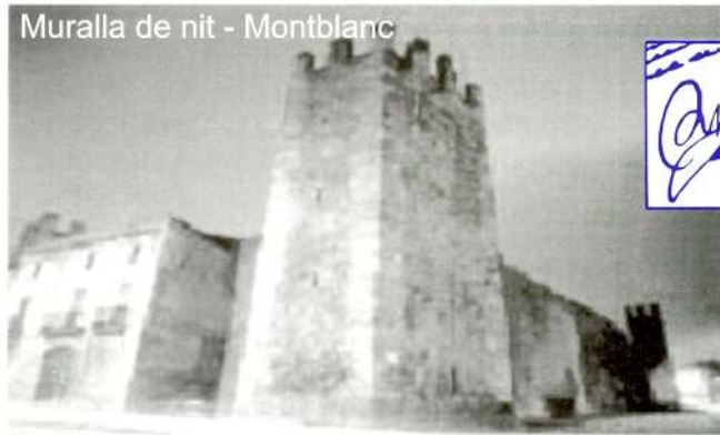
Muralla de nit - Montblanc

Les dels dies feiners les reserven per a grups