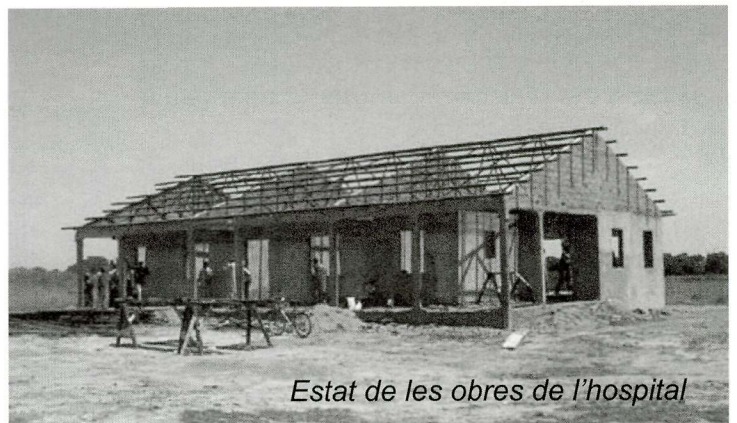
Estat de les obres de l'hospital

De tornada a Banjul, la meva capital, ells anaven pensant en la feina feta i la que encara quedava per fer, recordaven somriures i mirades netes de nens i nenes ansiosos per aprendre, orgullosos de lluir en el seu uniforme l'escut amb la meva bandera juntament amb la senyera catalana, una sorpresa inesperada i