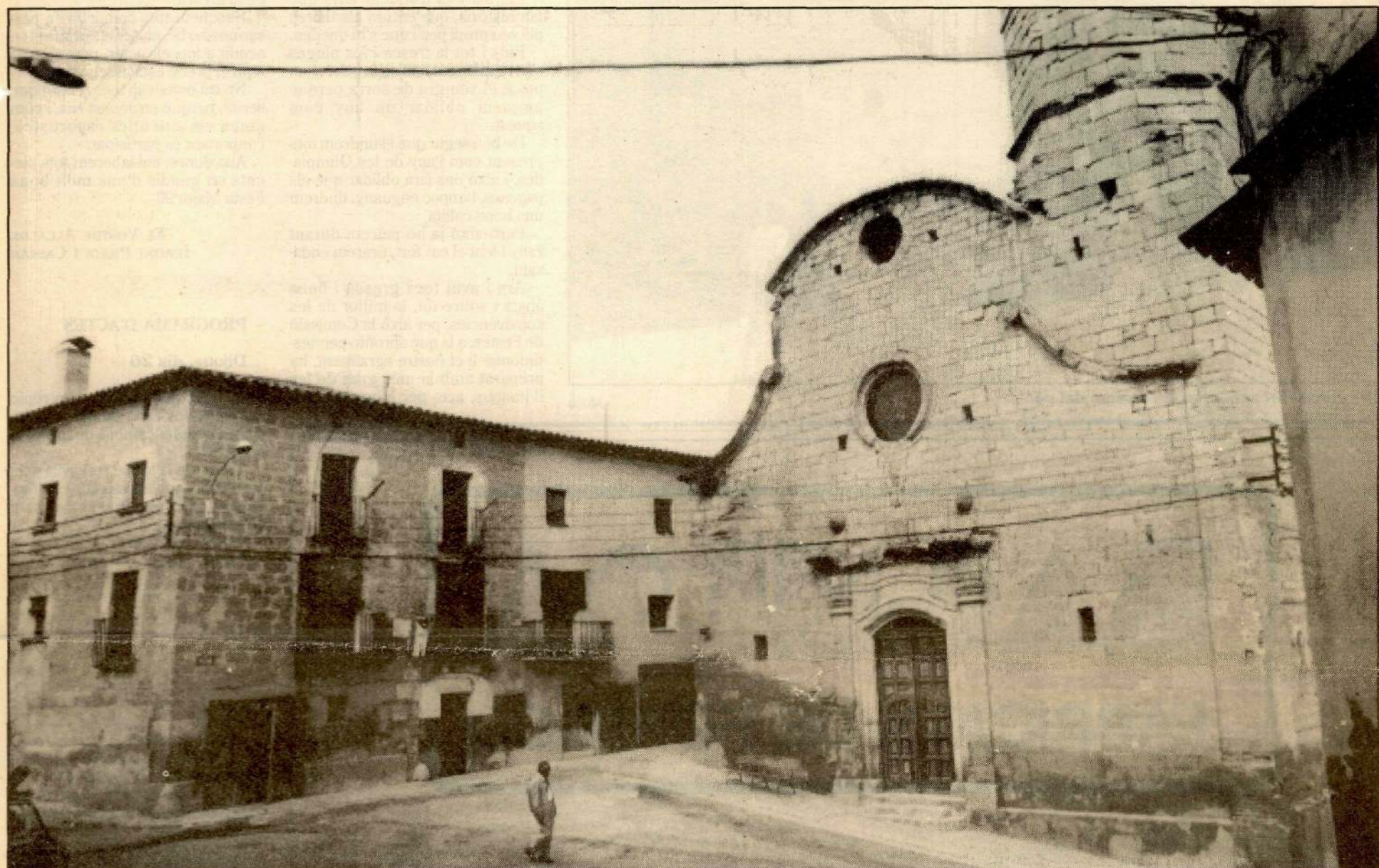
La festa major d'Alpicat es perllonga fins el dia 23 d'agost.