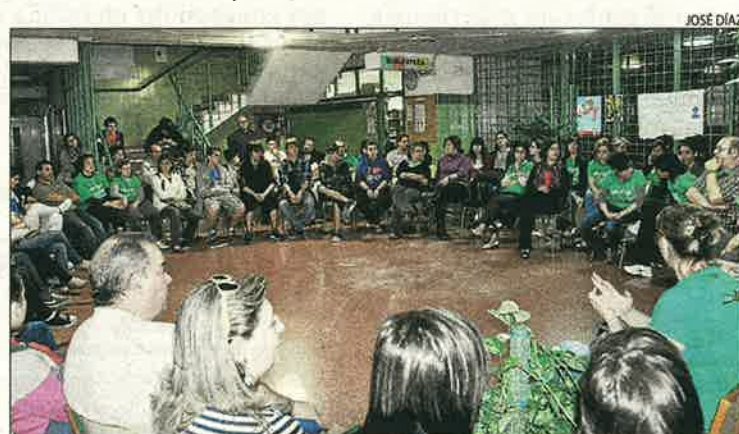
Docents, pares i alumnes van passar la nit a l'institut de Fraga.