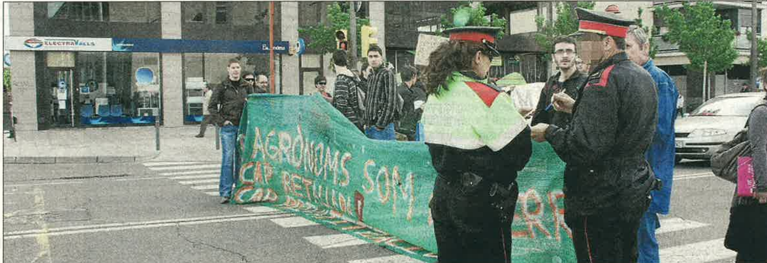
Un grup d'universitaris van tallar ahir accessos a Lleida com a prèvia a les mobilitzacions d'avui. A la imatge, davant del campus de Cappont.