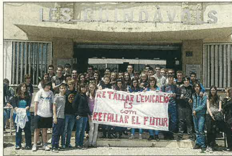
L'institut Guindàvols ja va protestar ahir contra les retallades.