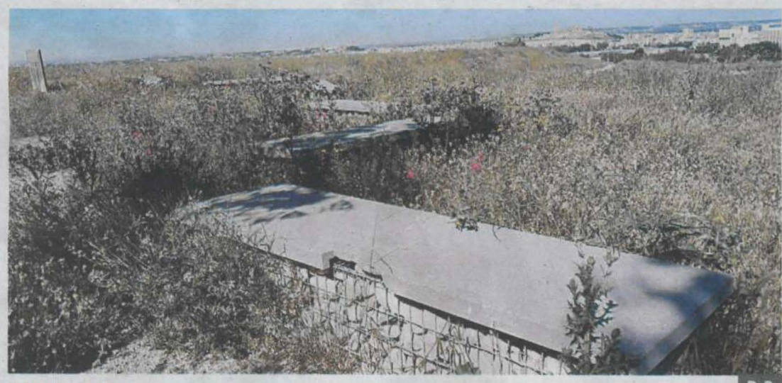
Els bancs per seure del mirador fa anys que estan deteriorats P.9

Els veïns van voler dedicar l'espai a l'apreciat paer del PSC