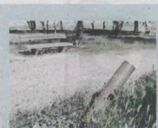
Un dels fanals danyats a l'espai públic

re i, en tot cas, la Paeria els va deixar atrotinats i sense manteniment.