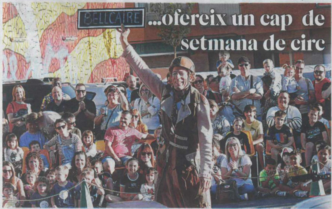
Un dels espectacles que es va gaudir a Bellcaire d'Urgell _P.17

El Vila-sana, fora de la final de la Copa pels penals _P.24