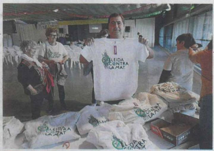
Un veí manifesta la seva oposició

L'Horta torna a rebutjar les línies elèctriques d'alta tensió