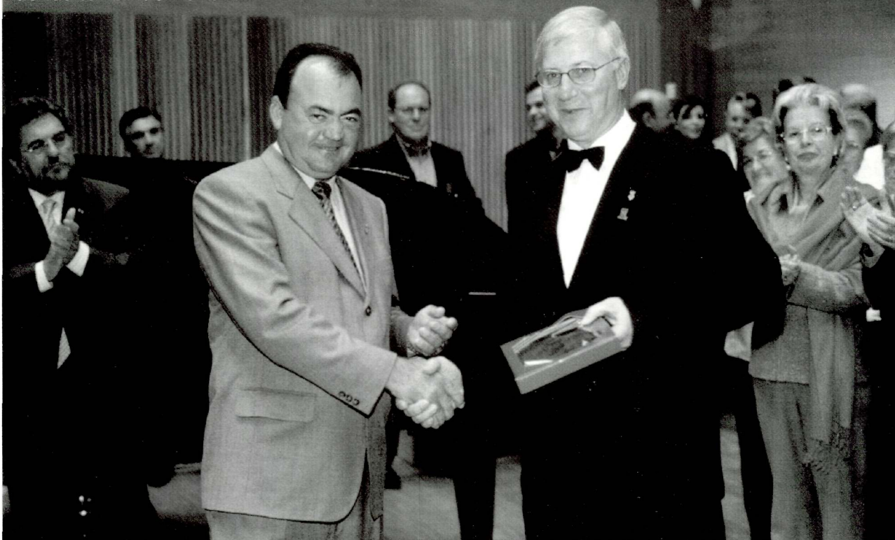
18 d'octubre de 2002, homenatge a les corals claverianes de les terres de Ponent.

També cantem a tots els actes possibles que es fan al nostre poble, a Alpicat: festa de Sant Sebastià, festa de Sant Isidre, Festa Major de Sant Bartomeu, festa d'homenatge als padrins (amb la participació de la coral infantil i juvenil), festa de les noces d'or de l'Associació de Jubilats, cantada d'havaneres dels Divendres a la Fresca, Missa del Gall, concert de les festes de