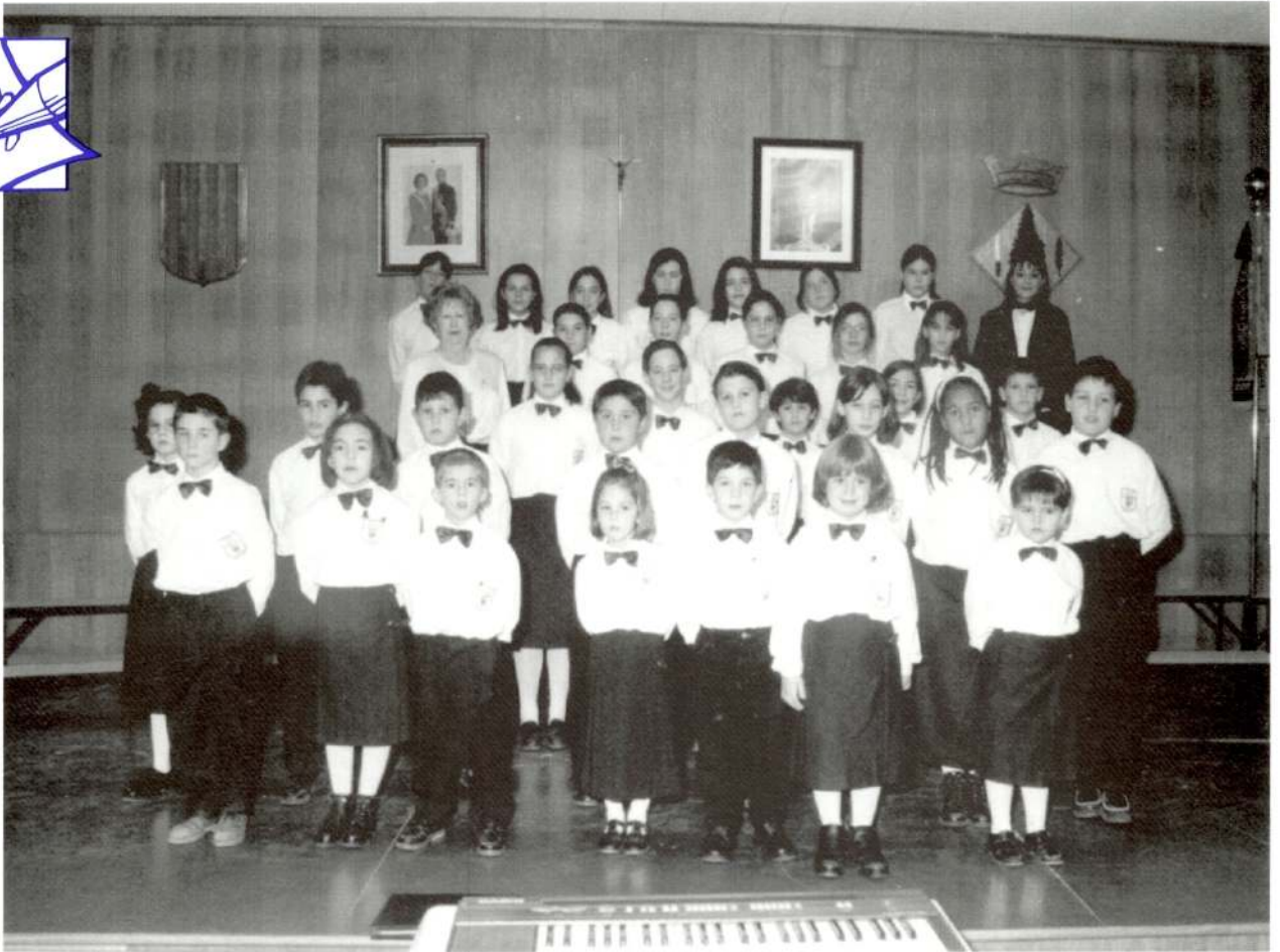
Coral infantil i juvenil