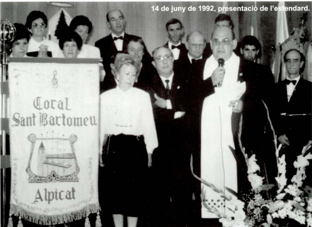
14 de juny de 1992, presentació de l'estendard.

També, durant la nostra curta-llarga trajectòria, depèn de com es miri, hem cantat en llocs tan