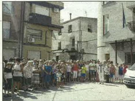
La Granja d'Escarp