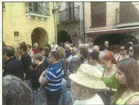
El Pont de Suert