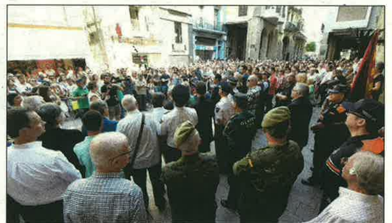
Els cossos de seguretat també van ser presents en l'acte

Després de guardar els tres minuts de silenci que van demanar les autoritats lleidatanes de manera rigorosa, els assistents van esclatar en un llarg aplaudiment que va marcar el final de l'acte d'homenatge.