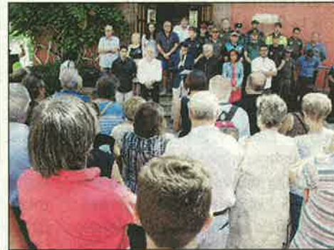
La Seu d'Urgell