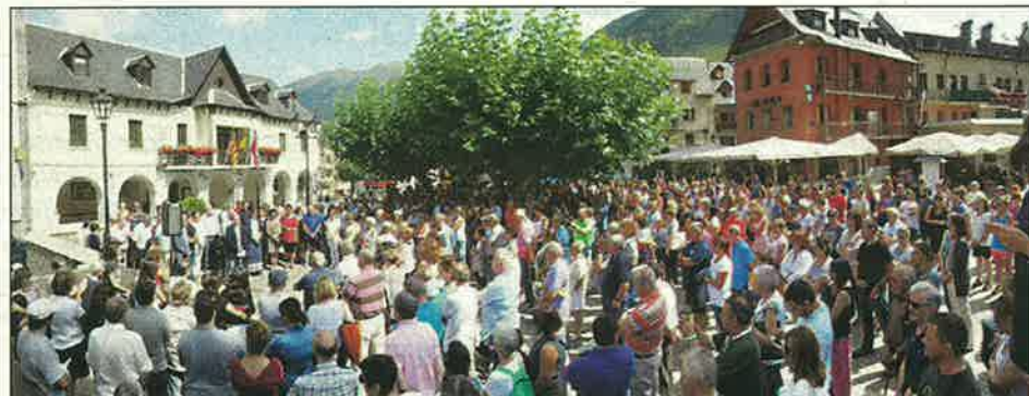
Vielha també va guardar uns minuts de silenci per les víctimes i els afectats en els atacs