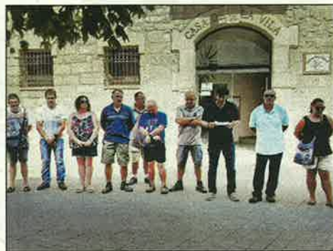
Puigverd de Lleida