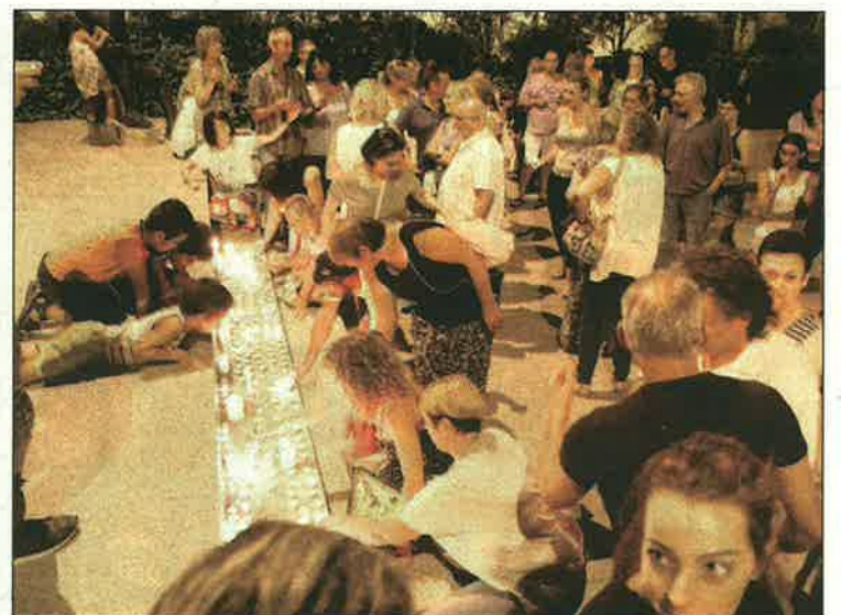
Almacelles també es va concentrar pels atemptats

Davant la magnitud dels fets, expressen "el més sentit condol a les famílies dels morts i als seus amics" i "la completa solidaritat i total suport als ferits". Tot i això, des del Centre Islàmic volen deixar clar que "l'Islam autèntic és aliè a aquests actes bàrbars i no es pot reconèixer en qualsevol acte de violència que fereix a innocents".