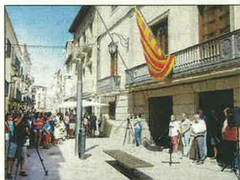
Les Borges Blanques