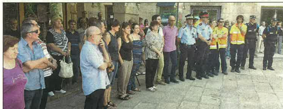
Tàrraga va omplir la Plaça Major per dur a terme una concentració silenciosa