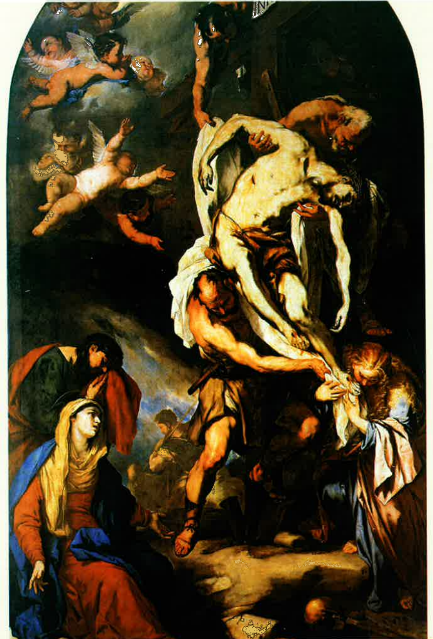
Luca Giordano (1634 - 1705): La deposizione dalla Croce (1653). Venezia, Galleria dell'Accademia, proveniente dalla chiesa di S. Maria del Pianto dei Servi di Maria.