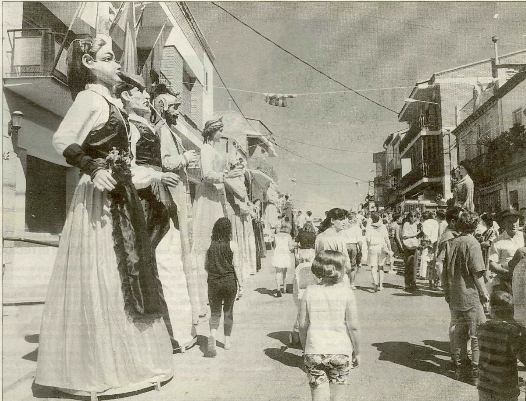
Campanes, coets i una cercavila anunciaran l'arribada de la Festa Major

Amb aquests records d'èpoques passades i la il.lusió po-