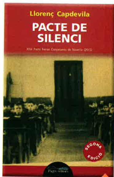
PACTE DE SILENCI Llorenç Capdevila (Pagès)

Els balanços són interessants. Els anys passen sense aturador, velocement. Un balanç pot ser un dic, un marge, un límit. 2016 ha estat l'any de l'acabament de la soledat. La pel·lícula que paradoxalment ho expressa és Corazón gigante . El film irlandès, del·là de les aparences lletges, mou subtilment la consciència cap a la llibertat, des de l'acceptació de la derrota. El gran llibre del 2016, sense gaires dubtes, és Suite Borgenca , escrit per Eduard Batlle. És la bandera esquinçada de les il·lusions de la classe mitjana. Els altres grans llibres de l'any, imperfectes però saludables són, al meu entendre, L'any del cérvol i Haru . Dues dones: Marina Espasa i Flàvia Company han encarat la vida des