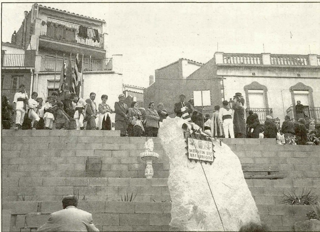
La plaça Jardí de les tres Esplugues, inaugurada el passat maig.

Salvador Amat i Flotats Batlle de l'ajuntament de L'Espluga Calba