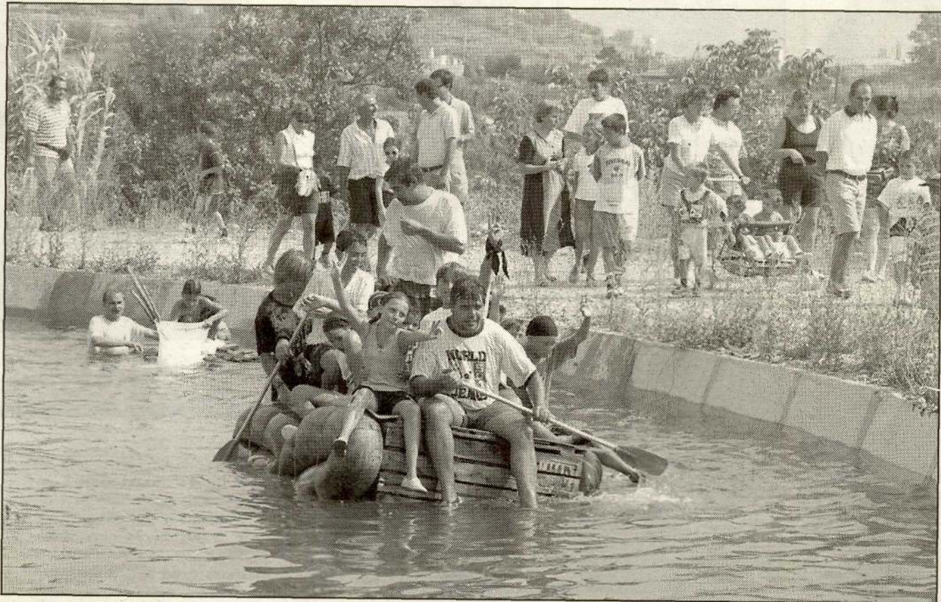
La baixada pel Rec Nou amb embarcacions originals refresca la festa.

A l'envelat, sessió de ball amb l'orquestra Selvatana.