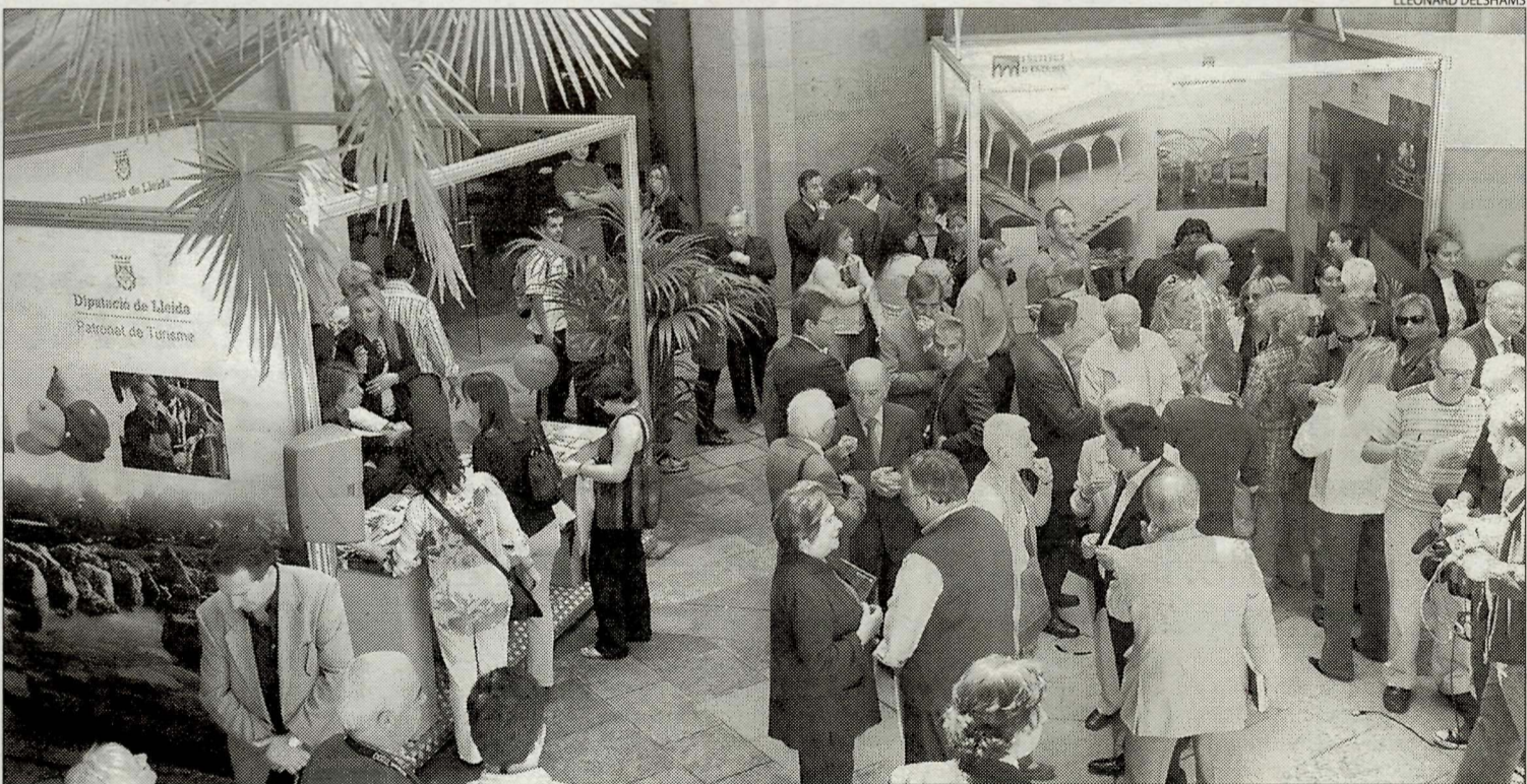
El pati de l'Institut d'Estudis Ilerdencs va acollir la recepció anual de Sant Jordi amb la presència dels escriptors de Lleida.