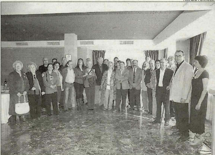
La jornada es va iniciar amb l'esmorzar de Pagès Editors a l'hotel Condés de Urgel.

■ Aprendre a aprimar-se i Els fruits de la vida , entre els llibres més venuts.