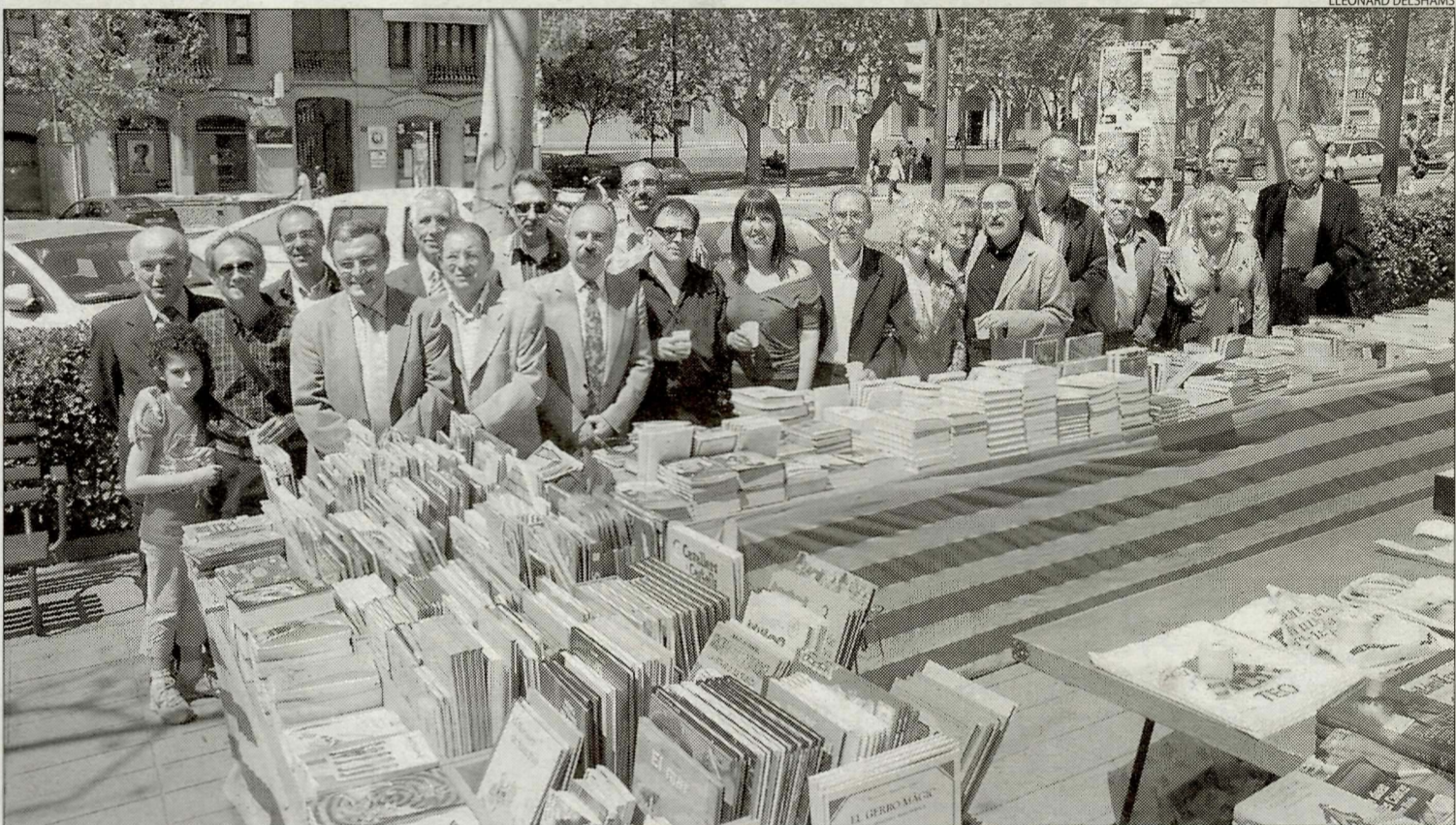
Una vintena d'autors van assistir al tradicional vermut literari que cada any organitza la llibreria Punt de Llibre.