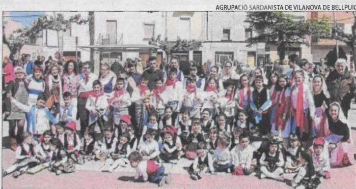
Imatge d'edicions anteriors.

El diumenge 4 d'abril se celebrarà a Vilanova de Bellpuig una nova edició de les tradicionals caramelles. Per poder aplicar amb rigor les mesures sanitàries, l'actuació tindrà lloc al pavelló Poliesportiu, prèvia reserva de seients. L'Agrupació