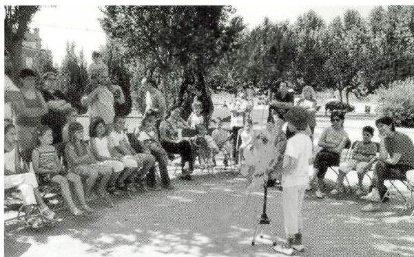
Marató de contes a la plaça de Bonaventura Verdú