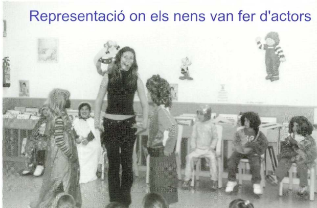
Representació on els nens van fer d'actors

Com cada any va arribar Sant Jordi i la Biblioteca va fer anys: ja en té 15! I per celebrar-ho tots plegats, petits i grans, ens vam reunir el dia 21 per gaudir de la representació que ens va oferir Lapsus Espectacles, titulada Càsting de Sant Jordi , on els nens assistents van fer d'actors.