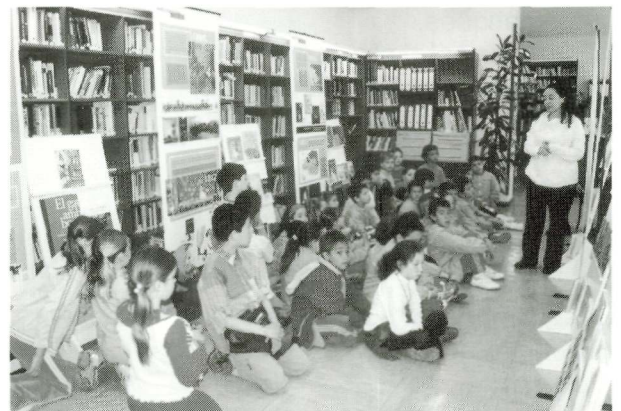
Visita guiada a l'exposició "Hans Christian Andersen"

Abans de Sant Jordi, però, les bibliotecàries vam tenir una setmana molt atafegada, ja que durant sis matins vam rebre els alumnes del CEIP Dr. Serés: els vam fer visites guiades a l'exposició "Hans Christian Andersen", un recorregut per la biografia i l'obra del famós escriptor danès a través de sis plafons.