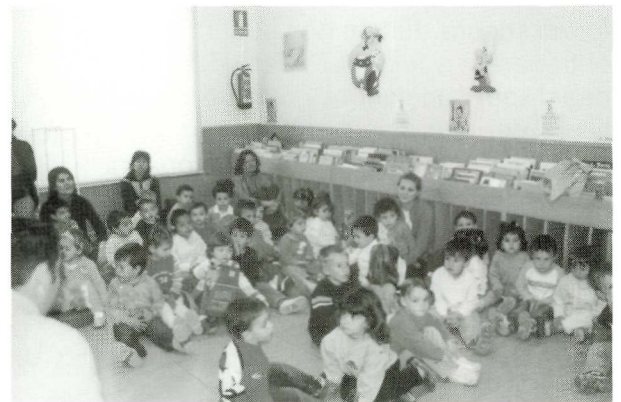
Els alumnes de P2 de la Llar d'Infants Municipal

acompanyats pels pares i tres mestres. Un cop asseguts i ben calladets a la sala infantil, els vam fer cinc cèntims de les normes bàsiques de funcionament i comportament a la biblioteca, els vam mostrar un munt de llibres de tota mena i de regal els vam explicar el conte titulat Ditona . Van marxar molt contents i els pares es van atipar a fer fotos.