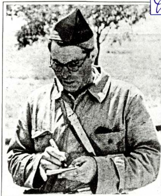
Bonaventura Durruti, anarquista i sindicalista mort el 19 de novembre de 1936 a Madrid

Després, alguns homes, entre els quals es trobava el meu pare, van pujar al campanar. Van tirar a terra la creu que estava collada sobre una pedra rodona.