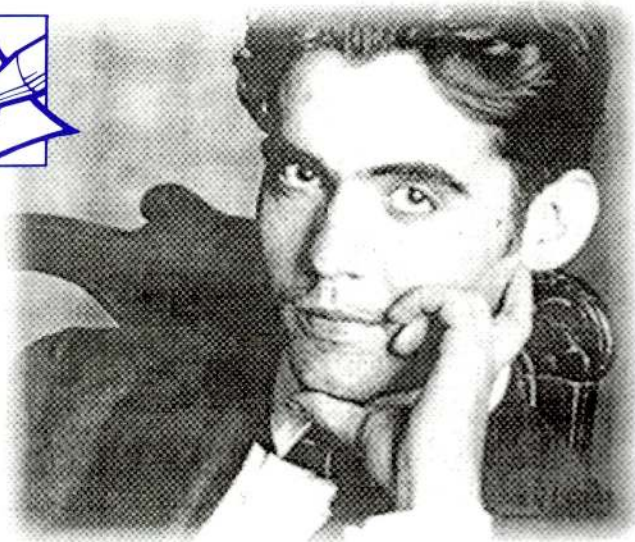
Federico García Lorca, poeta espanyol assassinat l'agost del 36, als 38 anys

Abans de la guerra havia fet alguna estada a Paris, a causa de les seves opinions, ja que eren molt avançades i molestaven Espanya. Llavors anava així, o marxaves o anaves a la presó. Ell conservava queixes molt profundes contra aquells que eren responsables de les seves repetides emigracions.