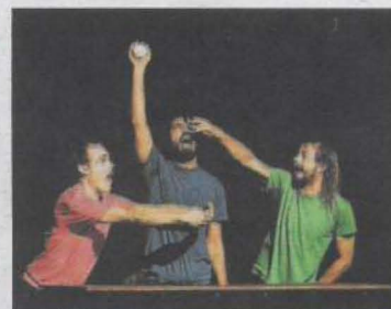
LPM actuaran dissabte.