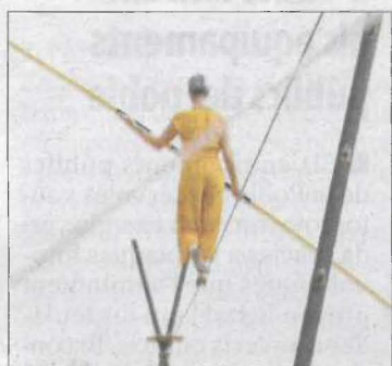
La Córcoles, amb l'obra 'H'.

sabte, amb un total de 10 representacions. Al matí, els malabars i clown de Magia de lejos i, a la tarda, més malabars amb