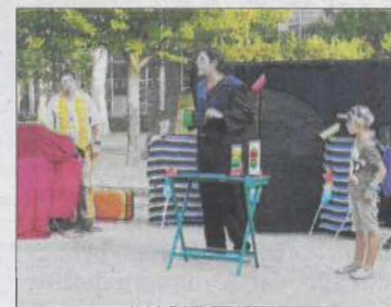
Sac Espectacles, diumenge matí.