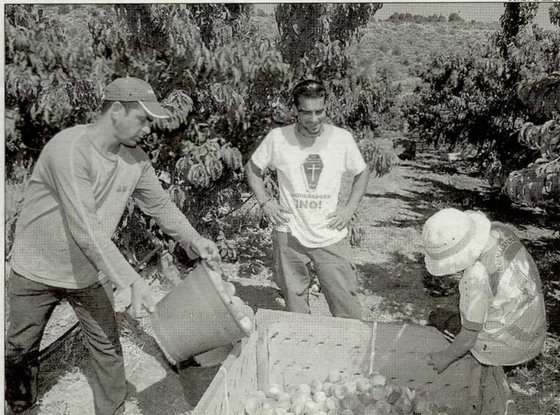
La imatge mostra els treballs de collita de préssec en una explotació del Baix Segre.