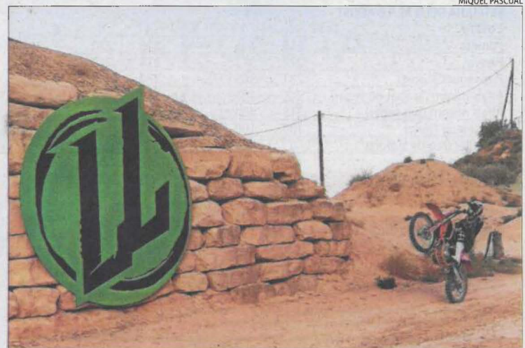
Imatge del lleidatà fent el cavallet.