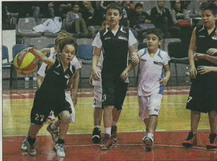
Les promeses del club van mostrar el seu nivell al descans.

llors que en els dos exercicis passats. En el primer a la categoria es va tancar la primera volta amb sis victòries, mentre que l'any passat es va arribar a l'equador sumant-ne cinc, dos menys que aquesta campanya. No obstant, en els dos casos l'equip era vuitè.