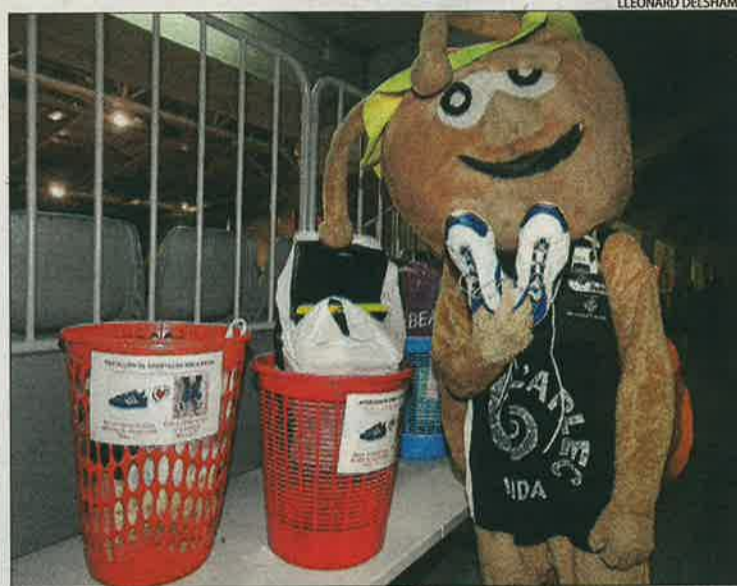
Durant el partit es va fer una recollida solidària de sabatilles.