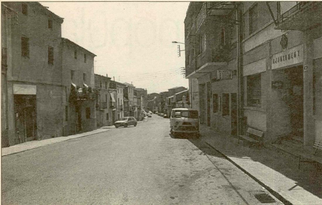
La gimcana automobilística recorrerà els carrers del poble.