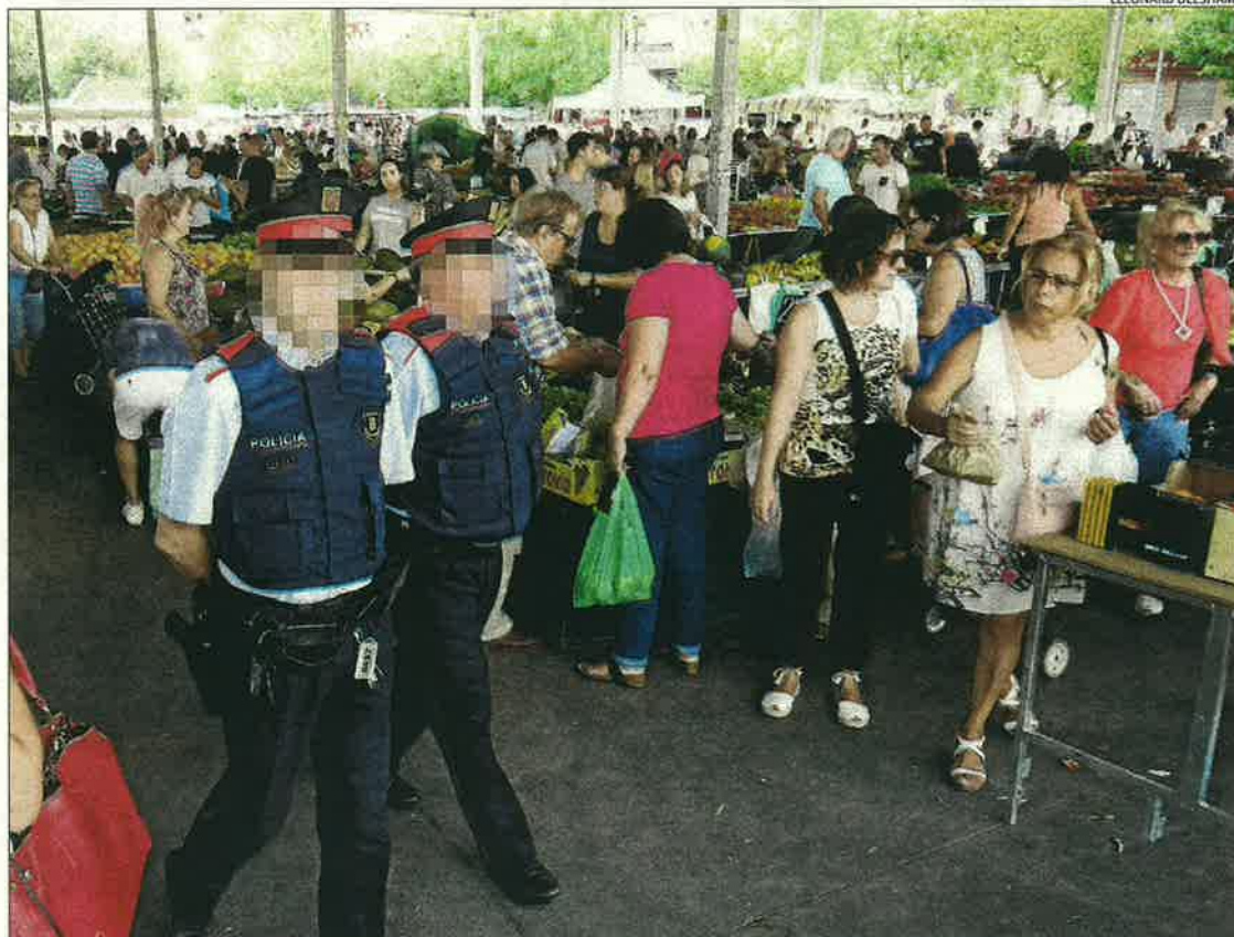
Dos mossos d'esquadra patrullaven ahir pel mercat setmanal de Pardinyes.