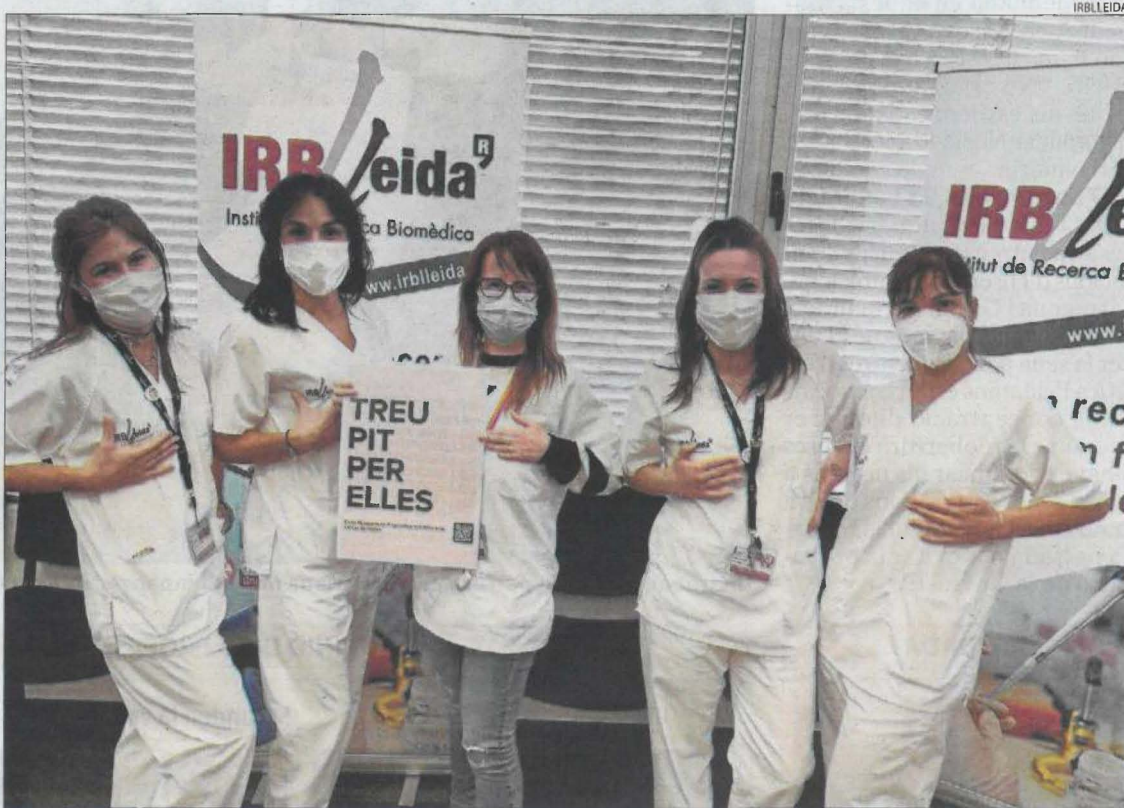
Personal de l'IRBLleida es van sumar ahir a la campanya #TreuPit pel càncer de mama.