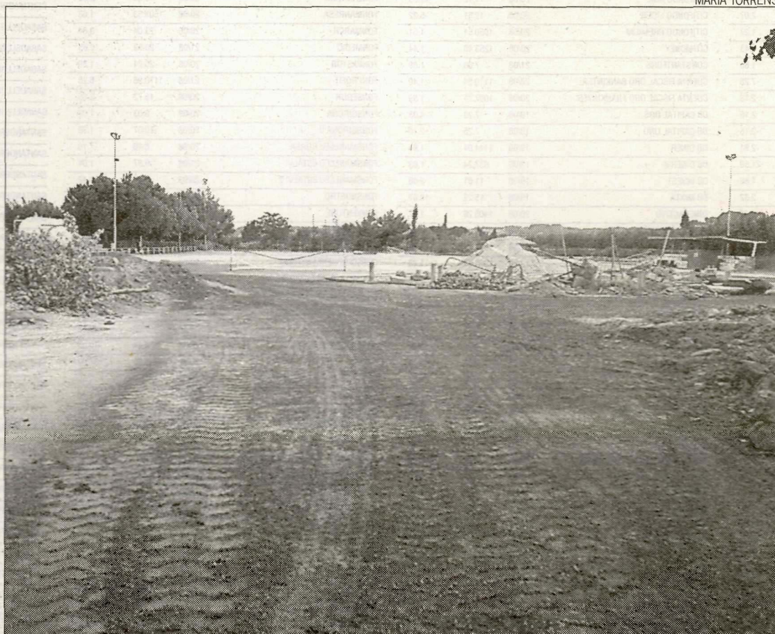
El parc del Graó d'Alpicat s'està condicionant per a la celebració del Meloman Alpicat Festival.

El camp de futbol del parc del Graó viurà aquesta nit l'estrena del festival amb les actuacions de grups que compten a les seues files amb almenys un