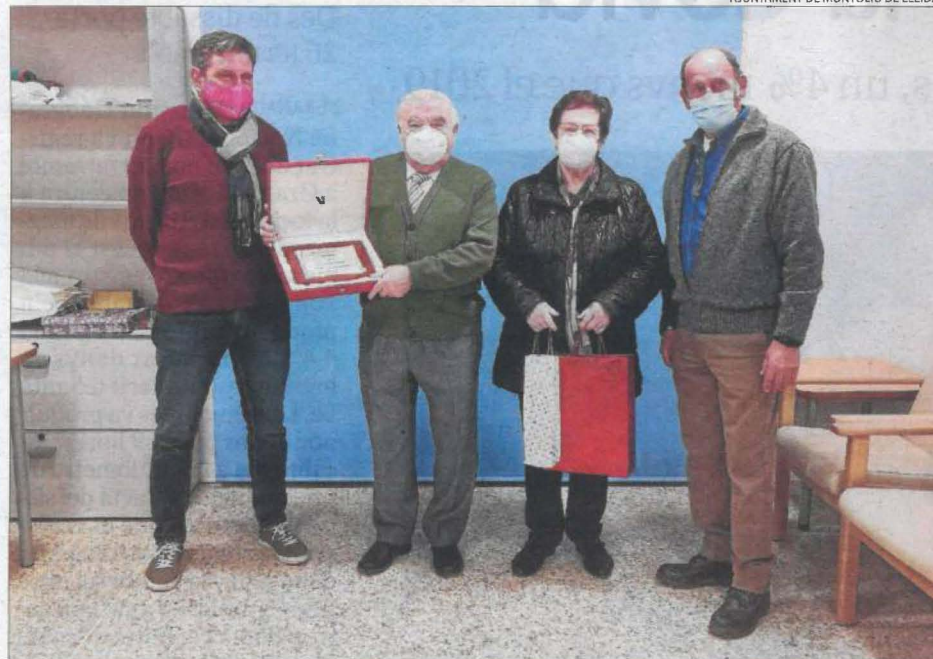
L'alcalde de Montoliu de Lleida, ahir amb un dels veïns de 80 anys homenatjats.