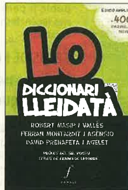
Lo diccionari lleidatà. Diversos autors (Fonoll)