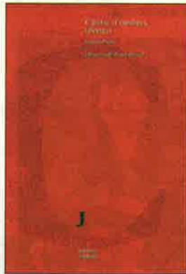
Jaume Pont. Càntic d'ombres (Perifèric poesia)