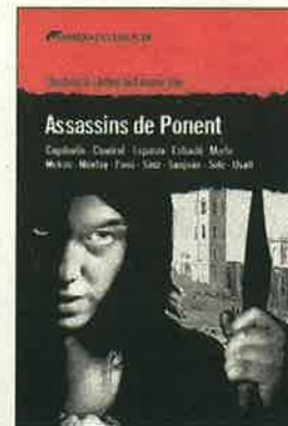
Assassins de Ponent. Diversos (Llibres del delictes)