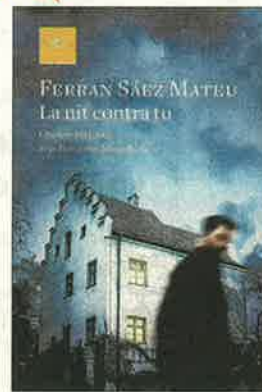
Ferran Sáez. La nit contra tu (Proa)