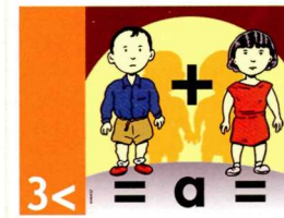
3 < promoure la igualtat de gènere i l'autonomia de la dona