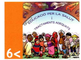
6 < combatre el VIH/sida, el paludisme i altres malalties