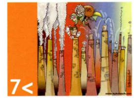
7 < garantir la sostenibilitat del medi ambient