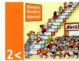
2 < assolir l'ensenyament primari universal