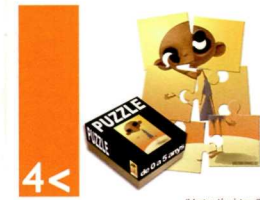
4 < reduir la mortalitat infantil