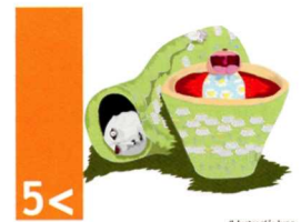
5 < millorar la salut materna