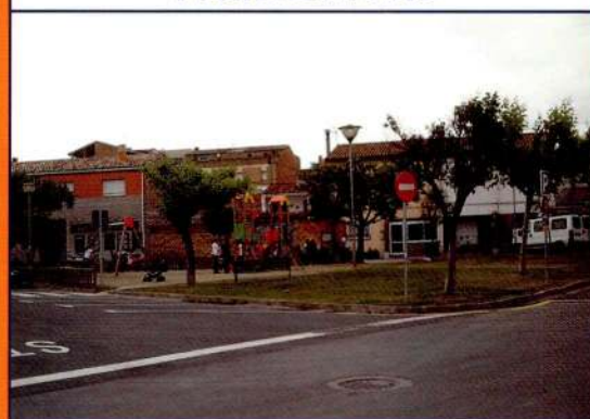
Plaça Dr. Serés