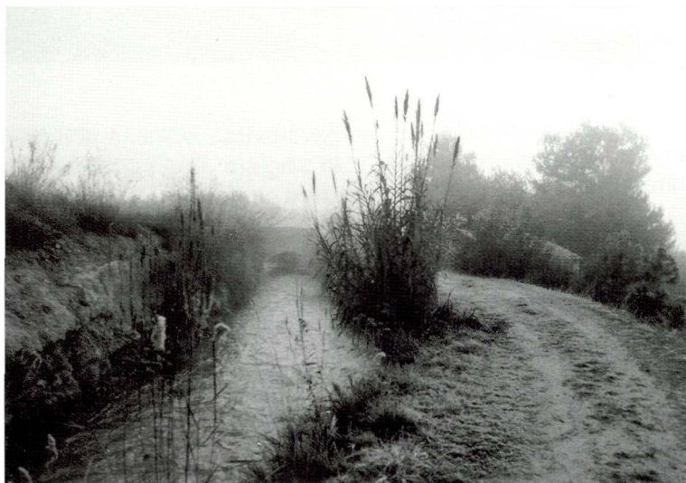
La sèquia del Cap, un límit del terme d'Alpicat. Foto any 1984.

Amb motiu de les obres de canalització del rec Nou, l'any 1998, vàrem escriure per a la Comunitat de Regants una ressenya sobre la història d'aquest canal, que avui posem, adaptat, a disposició de tots els lectors.