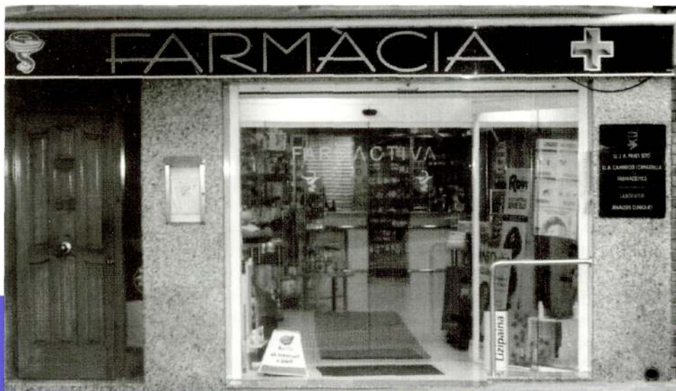
Foto actual de la farmàcia