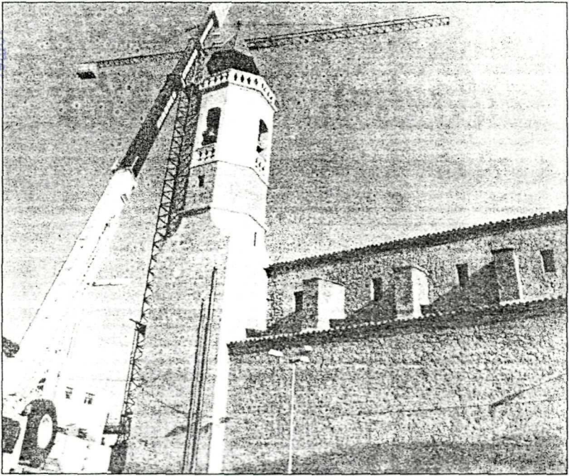
La tradició i la diversió es combinaran a la festa major.