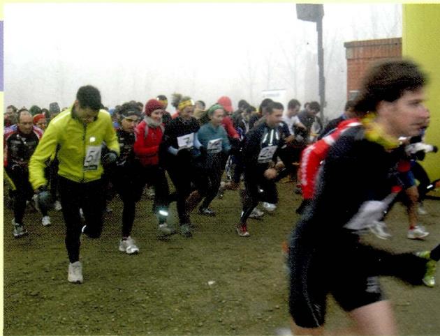
20 i 21 de gener de 2007, festa de Sant Sebastià i festa de l'Esport. Sortida de la 1a. Duatló d'Alpicat