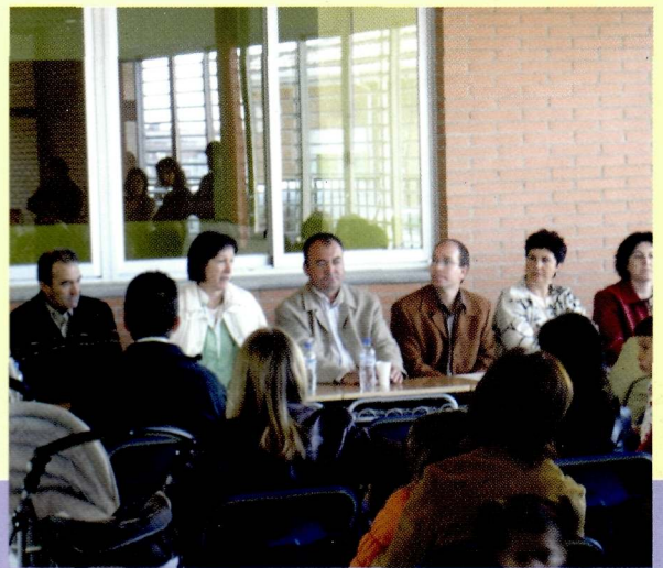
18 de març de 2007, portes obertes al CEIP Dr. Serés i a la Llar d'Infants Municipal l'Estel.