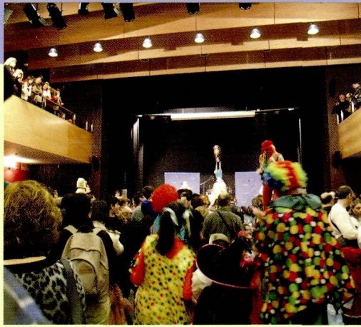
15 al 21 de febrer, carnaval