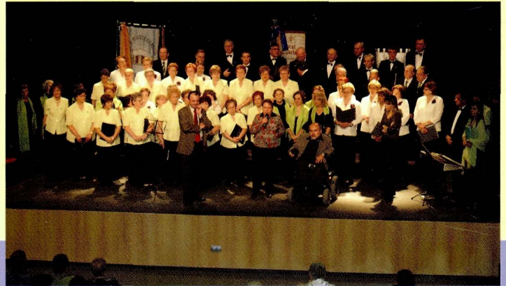
11 de febrer de 2007, animació i concert solidari a benefici d'ASPID i AREMI.