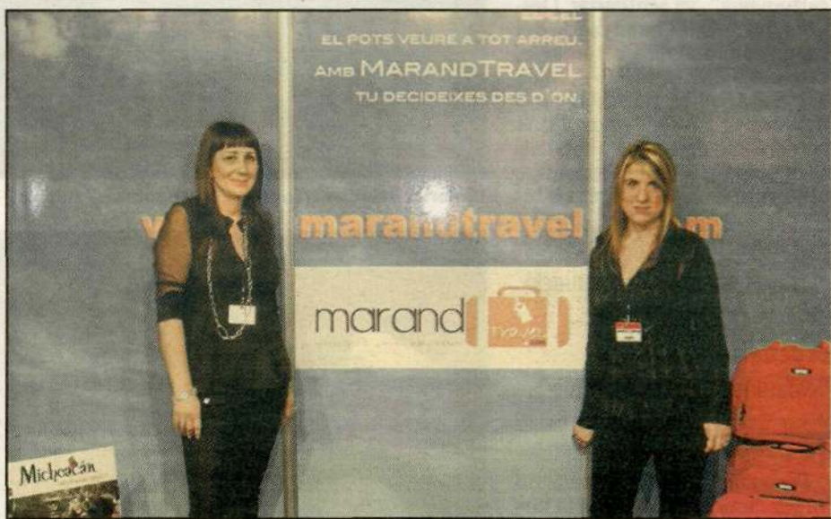
El cel el podeu veure a tot arreu. Amb MARAND TRAVEL vosaltres decidiu des d'on. Tel. 902 322 300. www.marandtravel.com