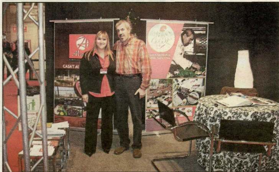
ALARI RESTAURANT Caseu-vos al cor de Lleida, C/ Josep Tarradellas Tel. 639 610 125. RESTAURANT PETIT CATALÀ, bodes a partir de 60€. petitcatala.com Tel. 973 736 405.