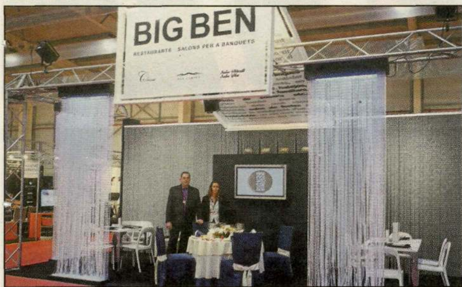
RESTAURANT BIG BEN, un any més present en aquesta fira, on exposa i proposa tot un ventall d'idees per al dia més especial de la teua vida.