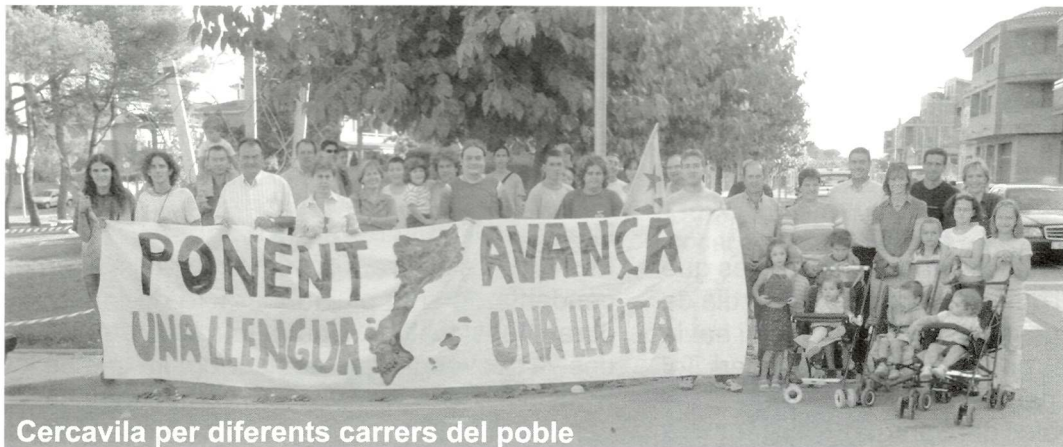
Cercavila per diferents carrers del poble