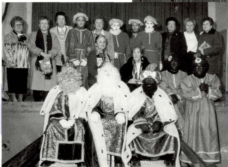
Voluntàries cosint i posant amb els nous vestits dels patges.