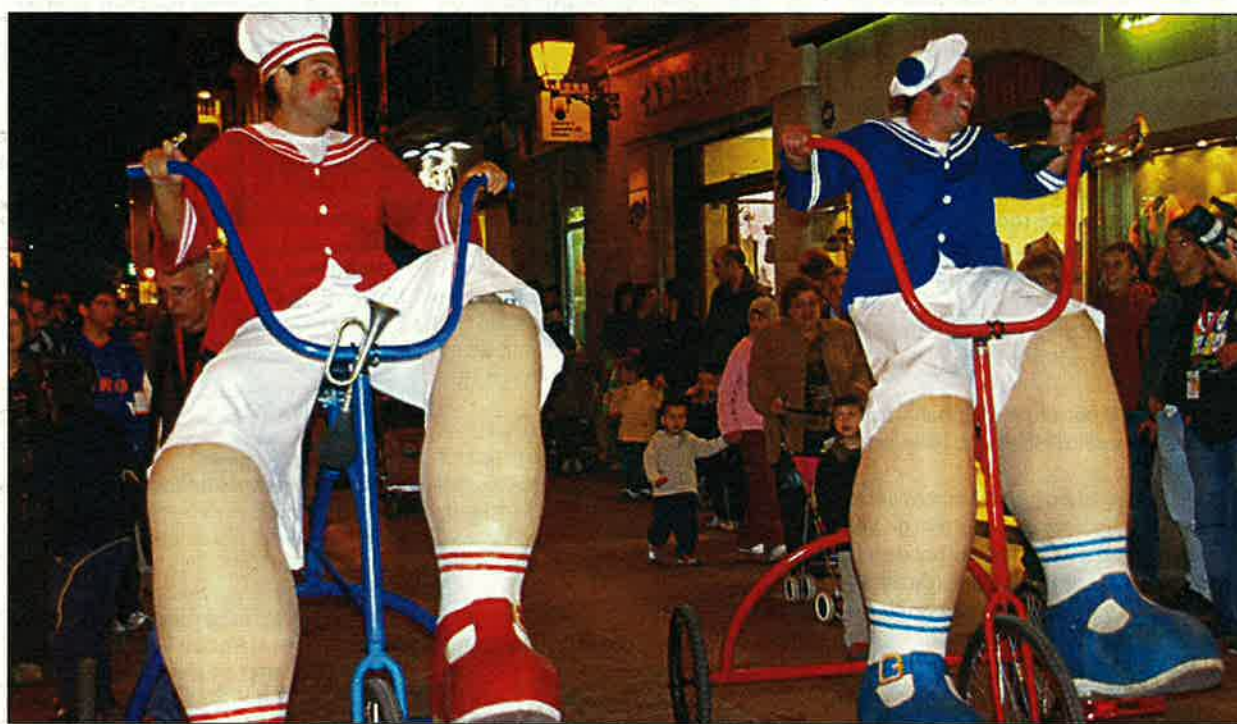
El grup d'animació Fadunito enceta avui la Festa Major d'Alpicat amb el seu espectacle 'La gran família'

Els infants seran un dels més beneficiats de la festivitat. Dijous tindran un espectacle de gegants, divendres podran jugar en un parc infantil amb inflables i més tard podran