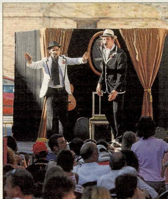
La companyia Tangorditos va oferir un espectacle d'humor i màgia a Alpicat.

Però no a totes les poblacions la festa es va acabar ahir. Per als que encara tinguin forces, poden continuar la diversió a Maldà, on avui hi haurà jocs per als més petits a les piscines municipals i un ball de tarda a càrrec del grup Banda Sonora.